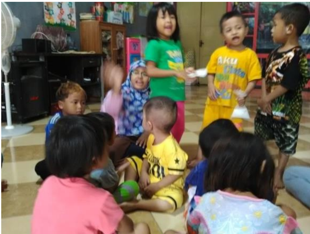
Ketika anak bernyanyi didalam kelas