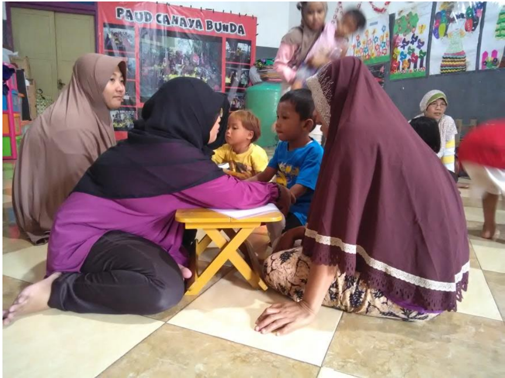
Pada saat penerimaan Rapor