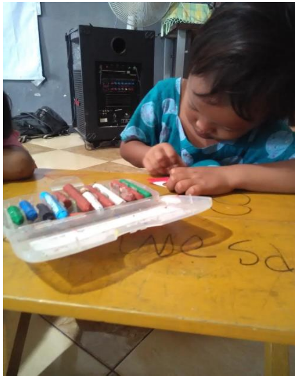
Pada saat pembagian boneka kertas