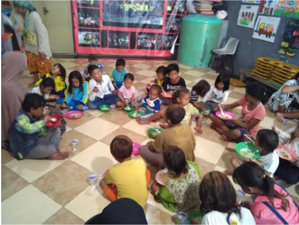
Makan bersama setelah penerimaan rapor