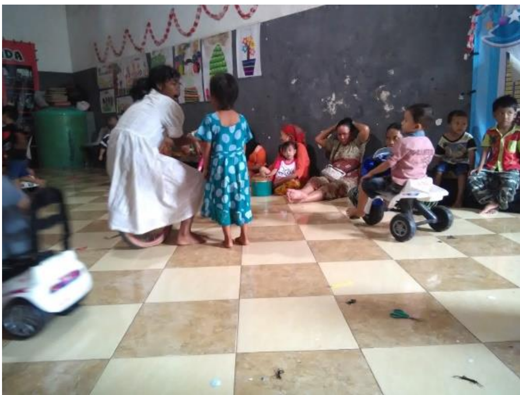
Kegiatan pada saat istirahat