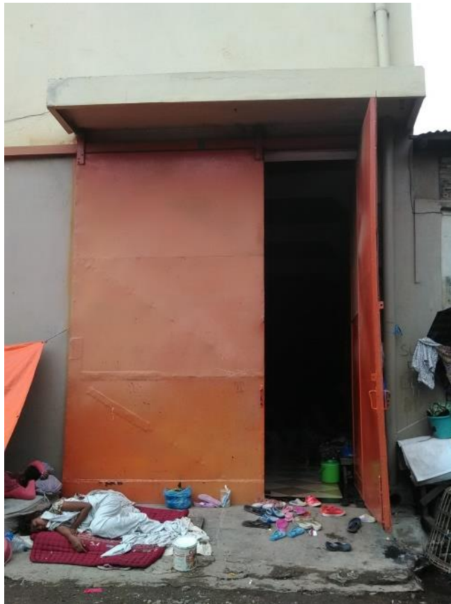
Ruangan PAUD Cahaya Bunda