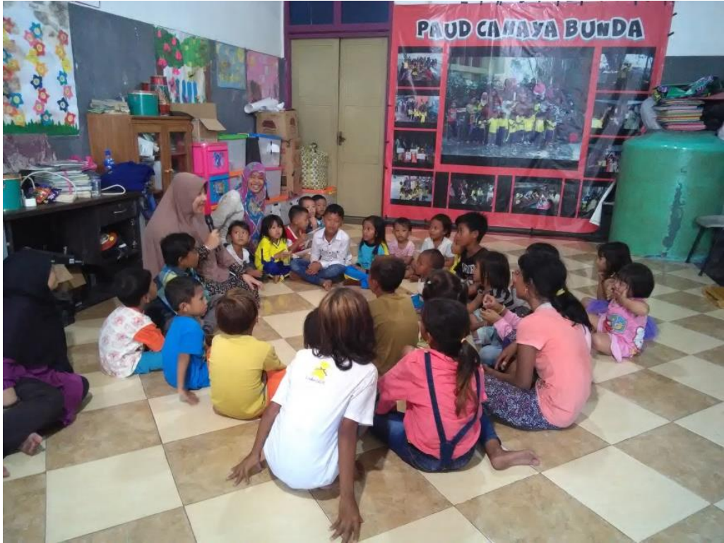
Kegiatan bercakap sebelum makan bersama