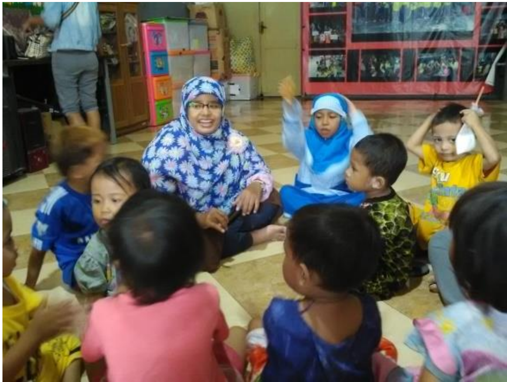
Pada saat kegiatan bernyanyi sebelum pembelajaran dimulai