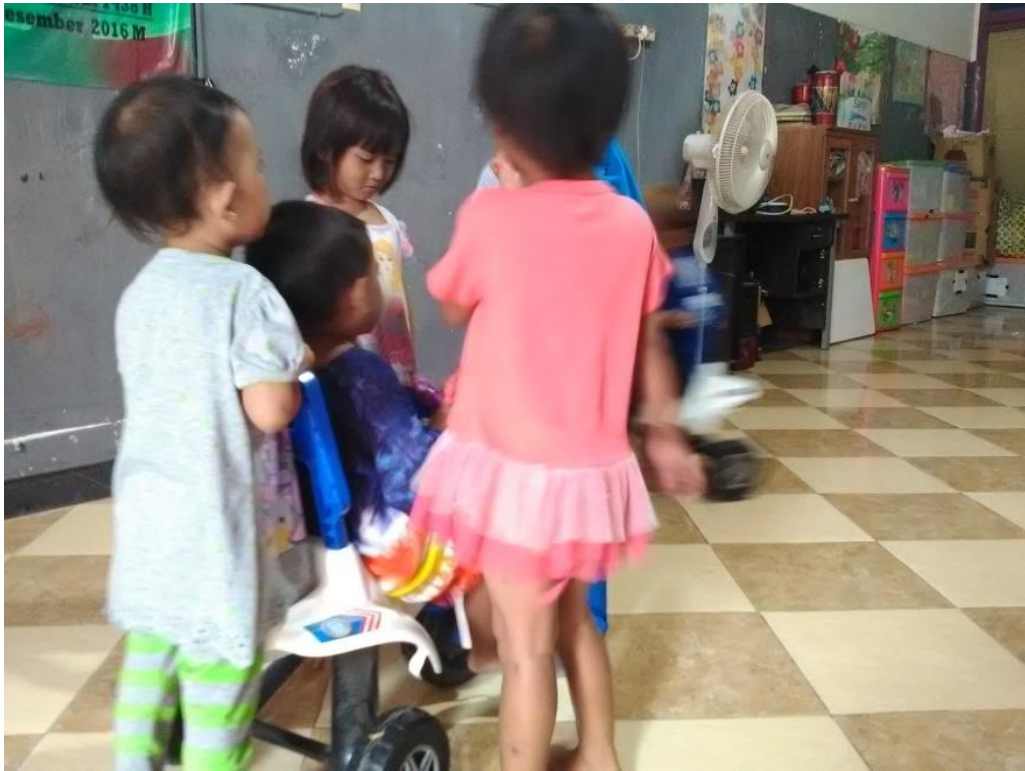
Bermain sepeda didalam kelas