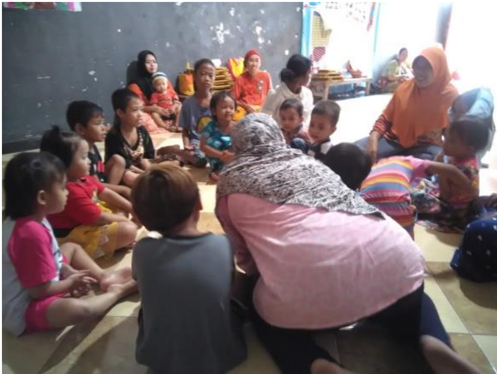
Saat mnjelaskan kegiatan pembelajara yang akan dilakukan