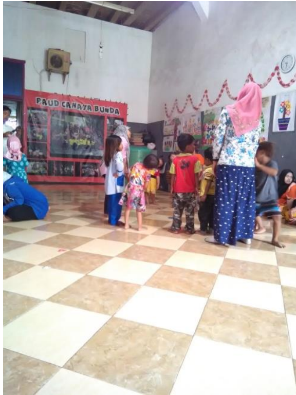
Kegiatan motorik kasar saat setelah istirahat