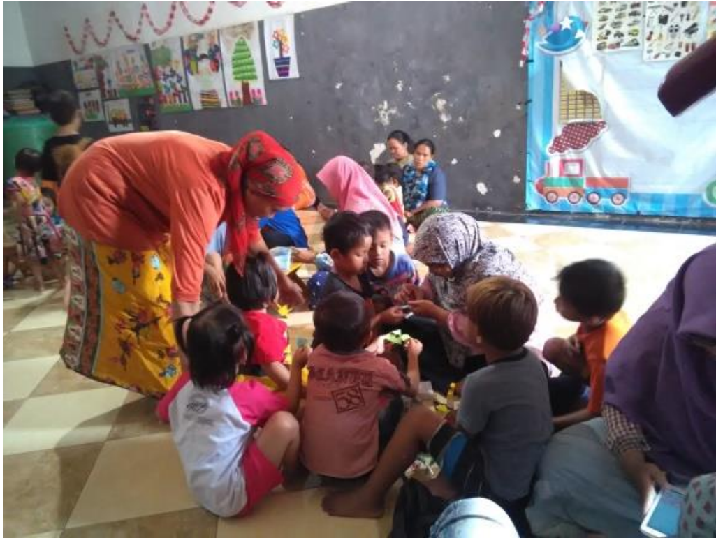
Suasana saat kegiatan menempel