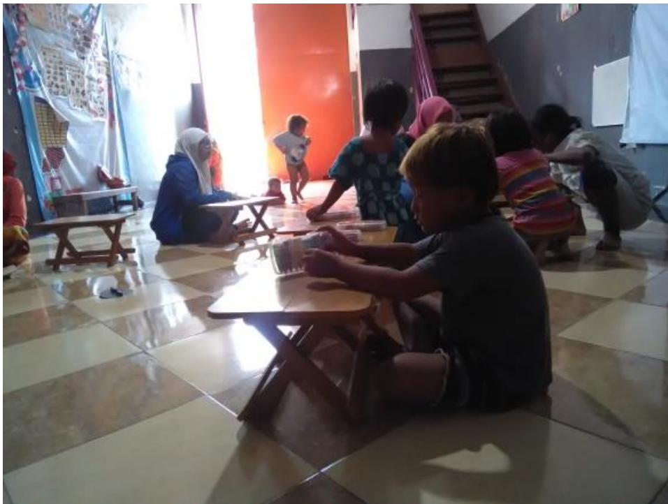
Saat setelah melakukan kegiatan