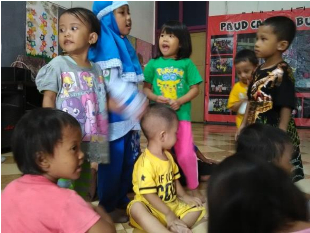
Anak usia 2-3 tahun bernyanyi di depan teman-teman