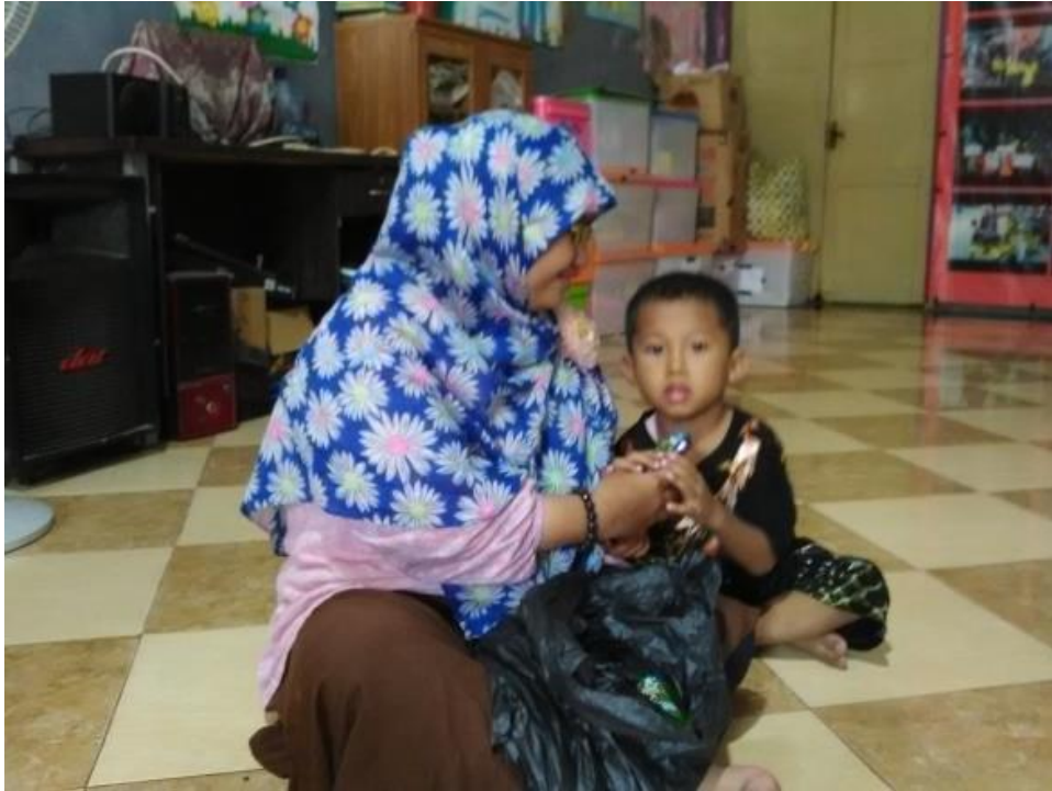
Pemberian susu dan makanan ringsn

Anak diberi susu dan makanan ringan saat pulang sekolah