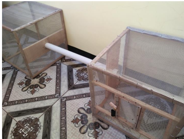
Gambar 3.5 Wadah lalat untuk penelitian