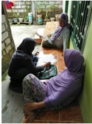
Penyebaran angket kerumah rumah