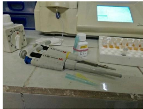
Menyiapkan alat dan bahan yang