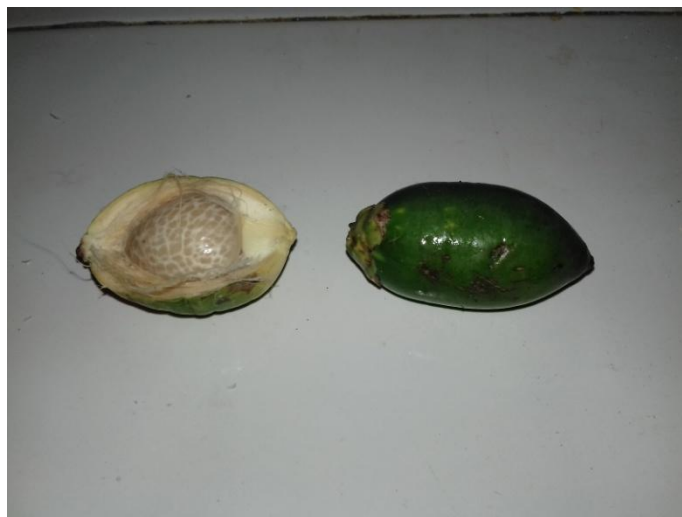
Gambar 2.3 : Buah pinang ( Areca catechu )

Di masyarakat umumnya spesies ini sering disebut dengan pinang atau pinang sirih.