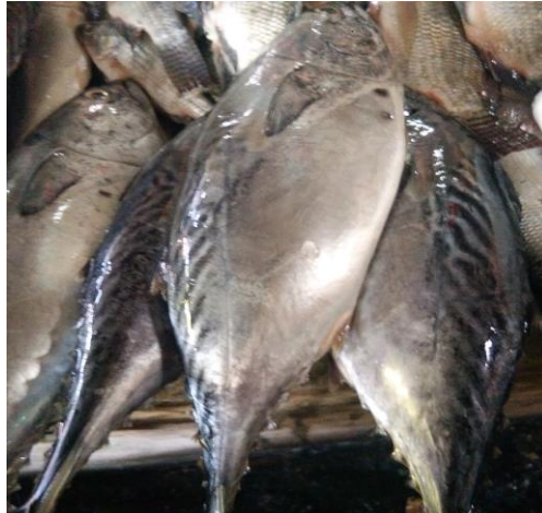
Gambar 2.2 Ikan Tongkol ( Euthynnus affinis )