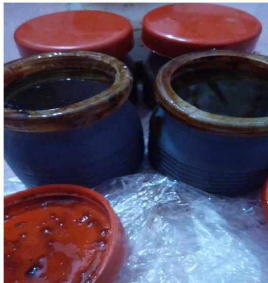
Gambar 2.1 Petis ikan tongkol (Dokumentasi Pribadi, 2017)

Petis ikan merupakan hasil olahan dari campuran ikan segar yang mengalami perlakuan, pencucian, penggilingan atau pencincangan dan pemasakan bersama dengan bahan tambahan. Petis ikan biasa dibuat dari bahan dasar kaldu ikan yang ditambah bahan pengental berupa tepung tapioka dan tepung beras serta bumbu-bumbu berupa bawang merah, bawang putih, daun salam, lengkuas, sereh, garam, gula merah, gula pasir (Gambar 2.1) (Martosubroto 1985).