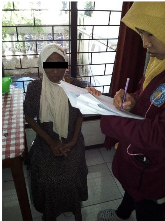
Dokumentasi responden lansia di UPTD Griya Werdha Surabaya Bulan April 2016