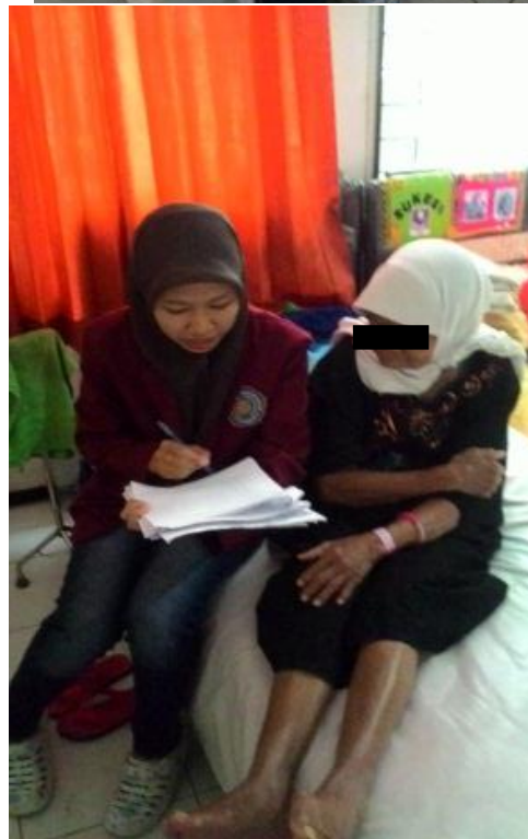
Dokumentasi responden lansia di UPTD Griya Werdha Surabaya Bulan April 2016