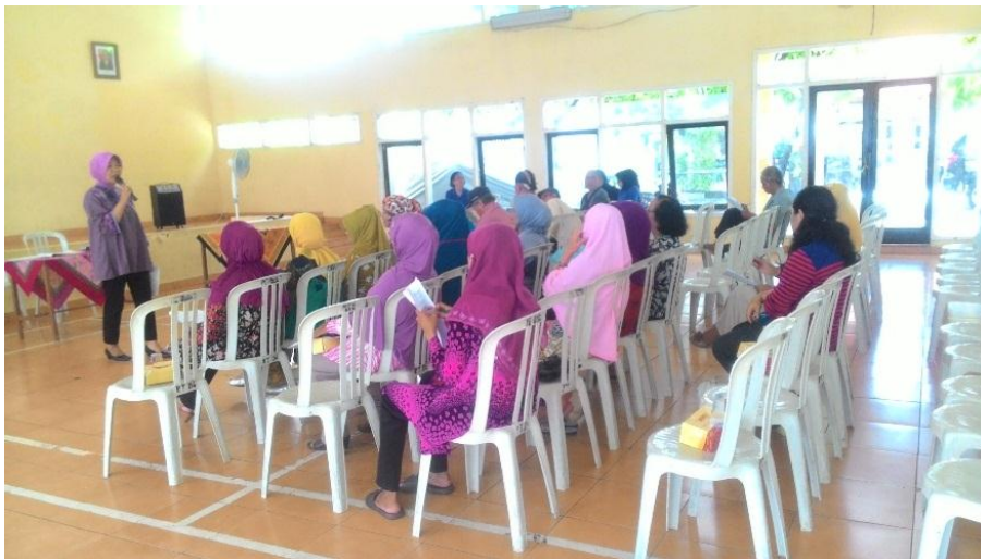
Dokumentasi responden lansia di posyandu lansia RW I dan RW VI Kelurahan Penjaringan Sari wilayah kerja Puskesmas Medoakan Ayu Surabaya Bulan April 2016