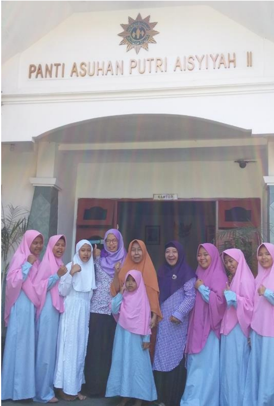
Foto Bersama -sama anak panti didepan Pantti Asuhan Putri Aisyiah Putri II Surabaya.