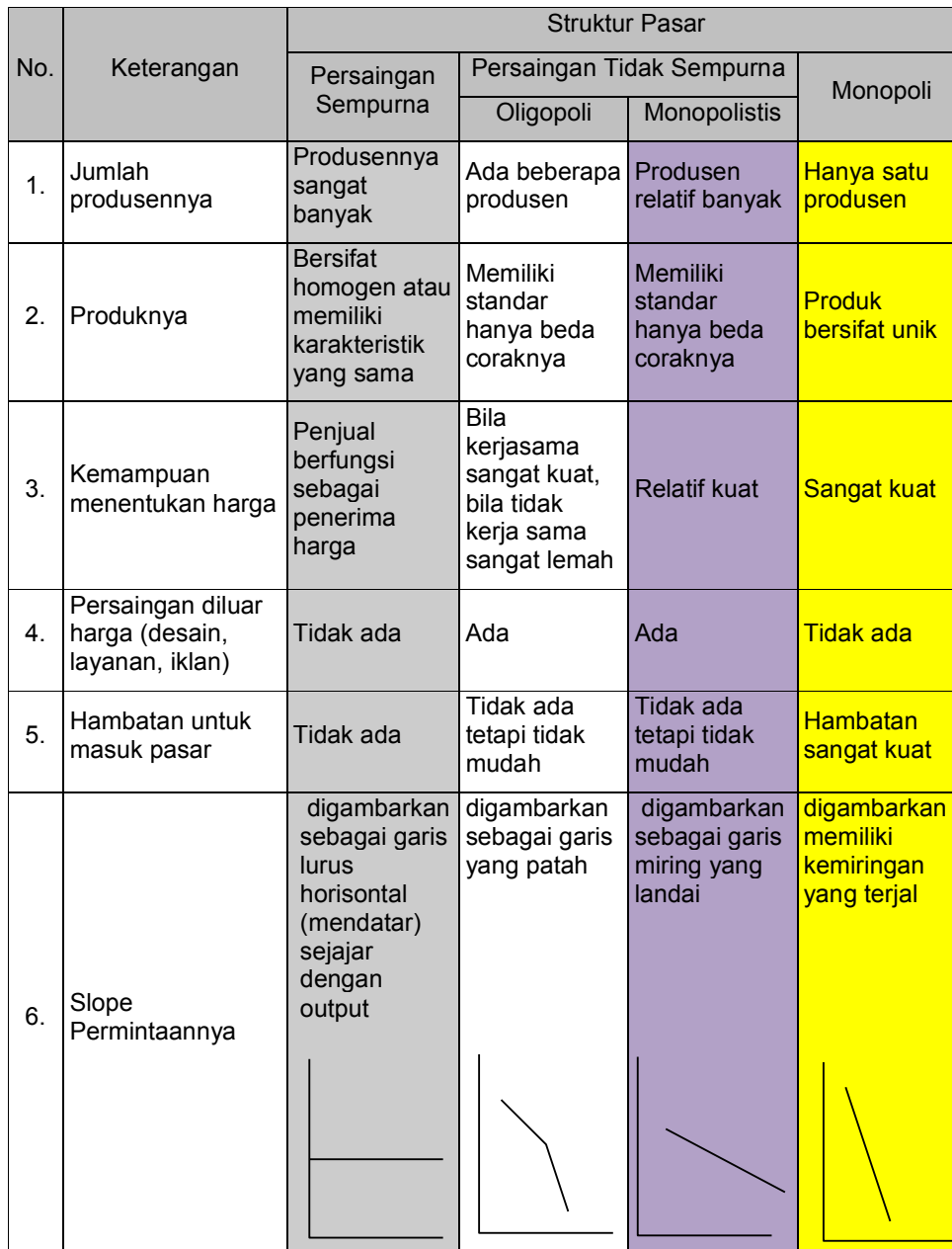
Tabel 1. Perbedaan karakteristik empat struktur pasar