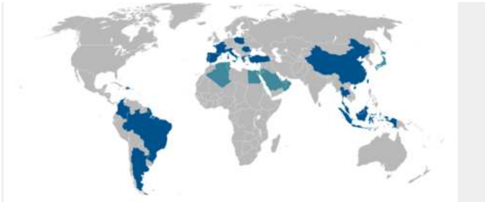
Gerai-gerai Carrefour di seluruh dunia.