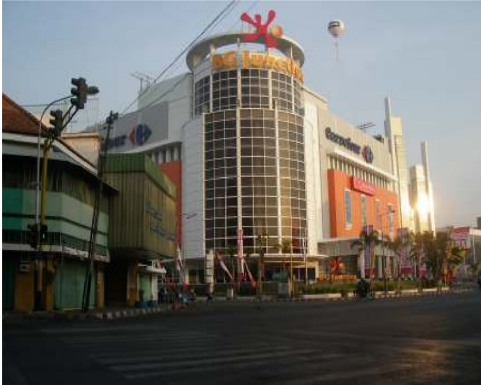
Gambar Carrefour di Surabaya, 27 Maret 2008.

Pada 22 Januari 2008 PT. Carrefour Indonesia melakukan akuisisi saham PT. Alfa Retailindo, Tbk. (ALFA) sebanyak 351 juta lembar saham atau sebesar 75 % dari 468 juta lembar jumlah saham PT. Alfa Retailindo, Tbk (ALFA). Total nilai transaksi ini sebesar Rp. 674 Milyar dengan harga per lembar saham sekitar Rp. 1.920. Dengan transaksi ini, me mantapkan posisi PT. Carrefour Indonesia sebagai pemain terdepan dalam persaingan pasar retail di Indonesia . ( Sinarharapan , 27 Januari 2008).