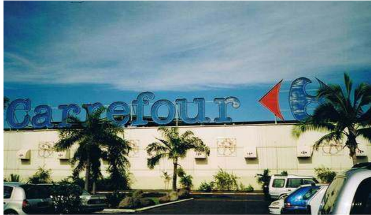
Wal-Mart. [1] Supermarket Carrefour di Faa'a, Tahiti, Polinesia Perancis