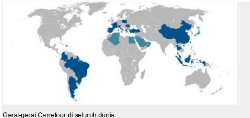
Gerai-gerai Carrefour di seluruh dunia.