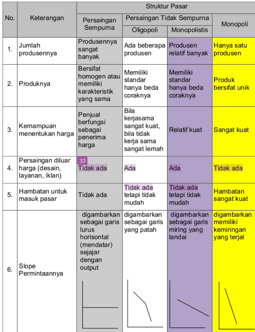
Tabel 1. Perbedaan karakteristik empat struktur pasar