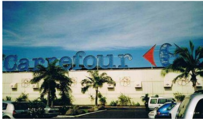
13 I-Mart. [1] Supermarket Carrefour di Faa'a, Tahiti, Polinesia Perancis