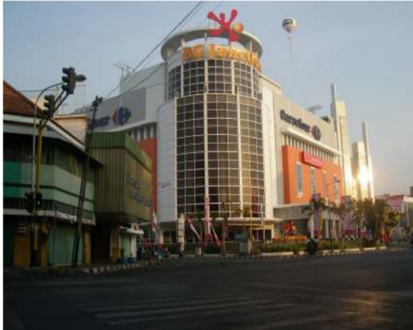
Gambar Carrefour di Surabaya, 27 Maret 2008.

Pada 22 Januari 2008 PT. Carrefour Indonesia melakukan akuisisi saham PT. Alfa Retailindo, Tbk. (ALFA) sebanyak 351 juta lembar saham atau sebesar 75 % dari 468 juta lembar jumlah saham PT. Alfa Retailindo, Tbk (ALFA). Total nilai transaksi ini sebesar Rp. 674 Milyar dengan harga per lembar saham sekitar Rp. 1.920. Dengan transaksi ini, me mantapkan posisi PT. Carrefour Indonesia sebagai pemain terdepan dalam persaingan pasar retail di Indonesia . ( Sinharapan , 27 Januari 2008).