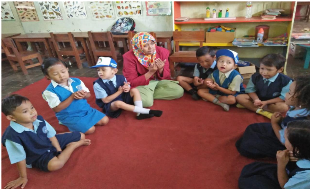
GAMBAR 17 DO'A SESUDAH KEGIATAN