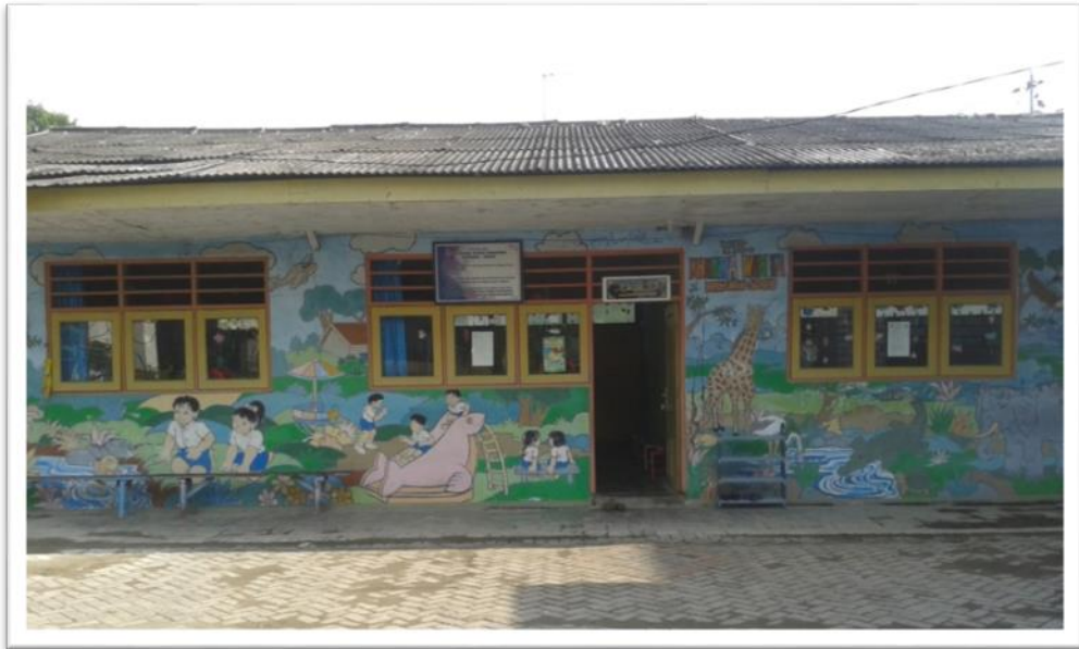
GAMBAR 1. GEDUNG TK DWP MRIYUNAN