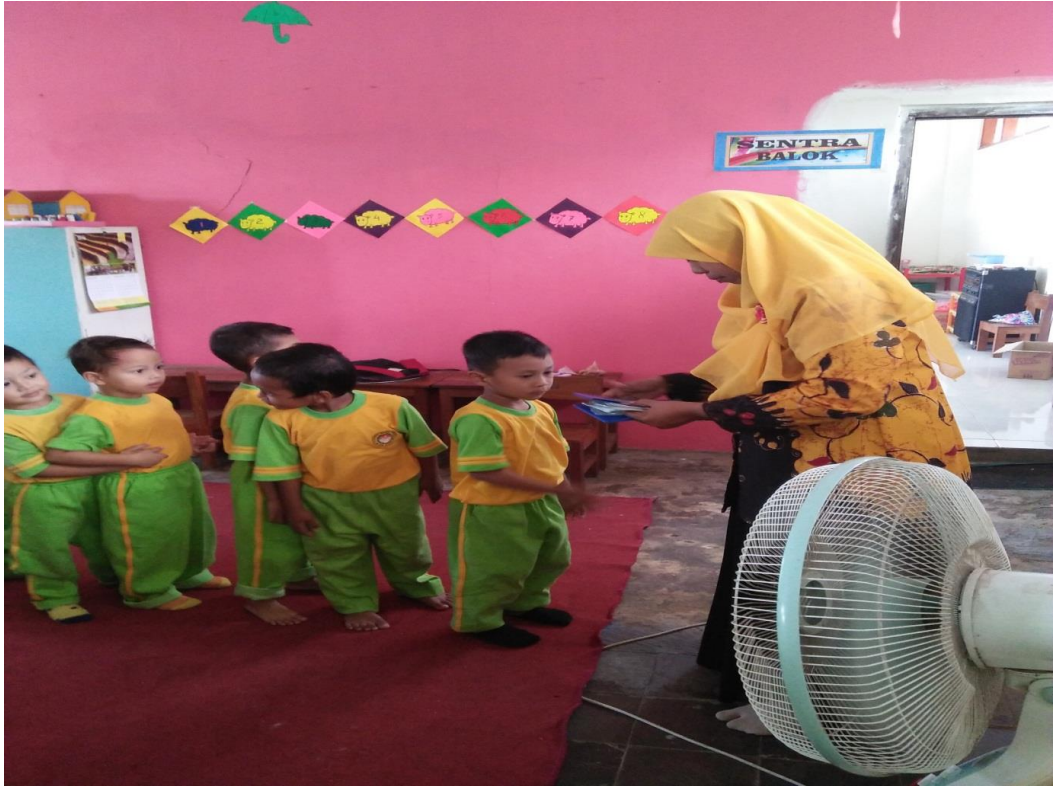
GAMBAR . 11 BARIS , PEMBAGIAN TABUNGAN ,PULANG