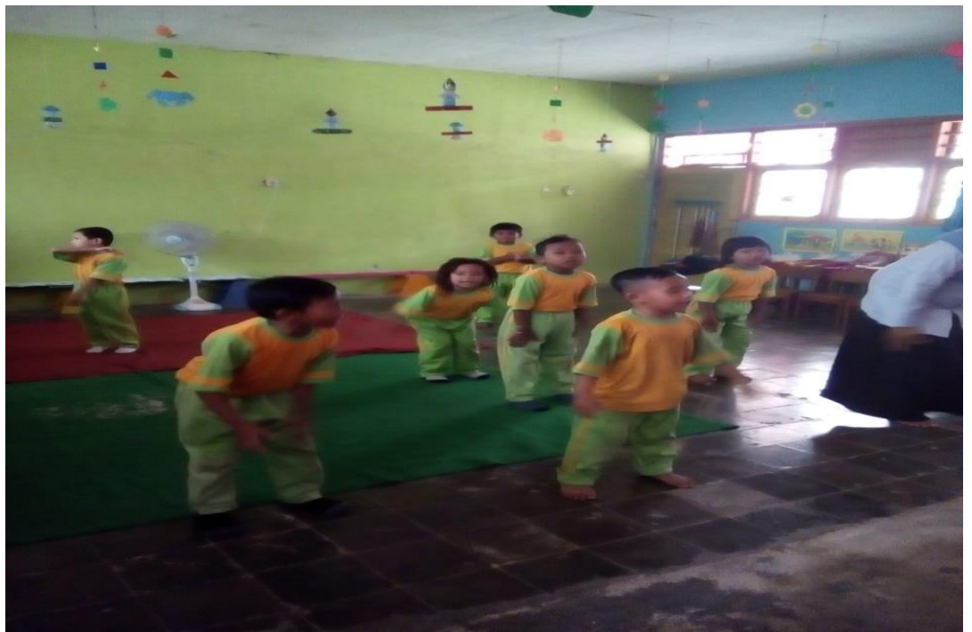
GAMBAR. 8 MENIRUKAN GERAK SESUAI IRAMA MUSIK