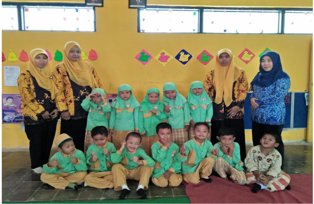
CAMBAR .3 FOTO GURU DAN MURID