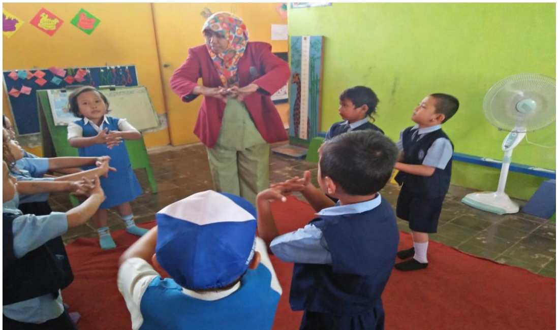
GAMBAR 15 MENIRUKAN GERAK DAN LAGU DENGAN BERHADAPAN