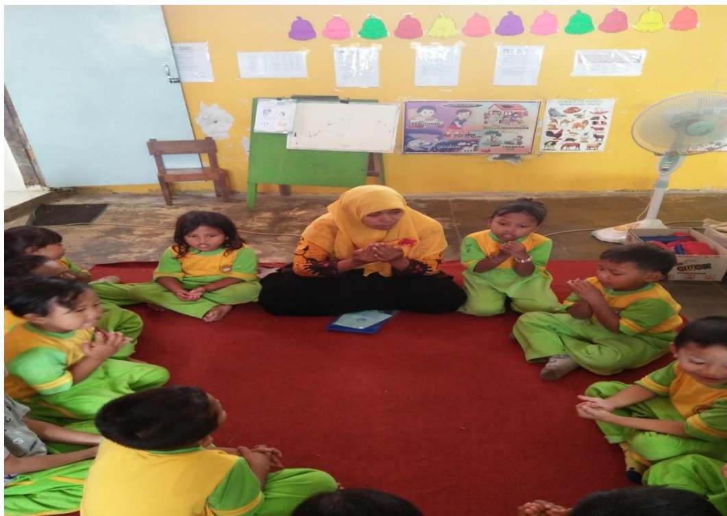
GAMBAR .10 DO'A SESUDAH KEGIATAN