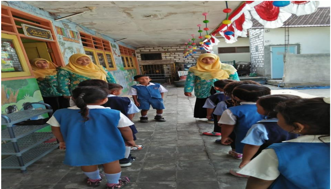
GAMBAR . 12 KEGIATAN BERBARIS DI DEPAN KELAS