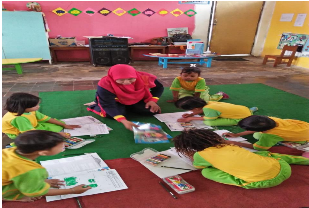
GAMBAR . 9 MEWARNAI GAMBAR KEGIATAN