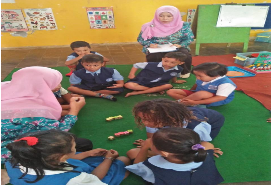
GAMBAR . 14 MENJELASKAN KEGIATAN HARI INI