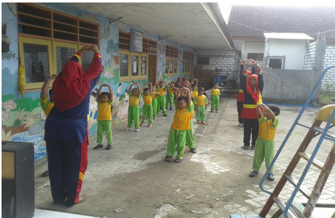
GAMBAR. 5 KEGIATAN SENAM BERSAMA GURU DAN MURID