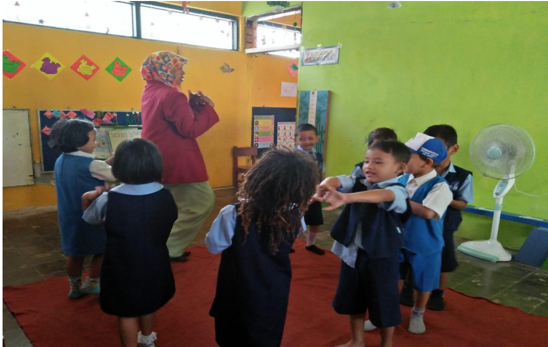
GAMBAR 16 MENIRUKAN GERAK DAN LAGU DENGAN CARA MEMUTAR