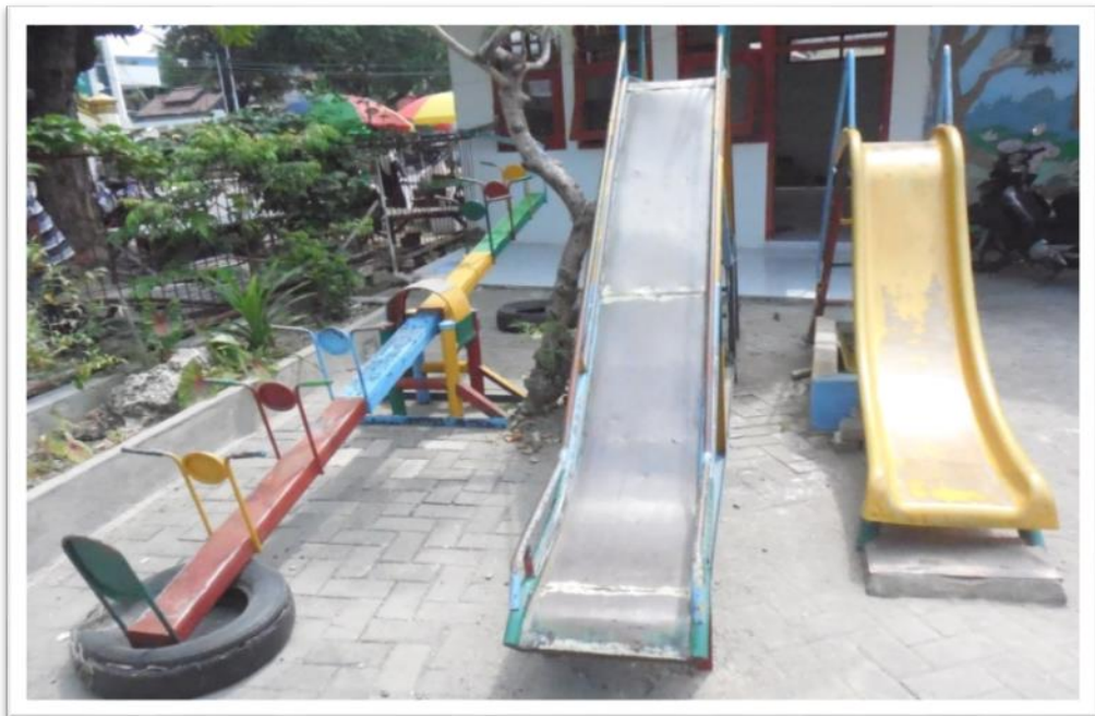
GAMBAR. 2 PERMAINAN ANAK DILUAR KELAS