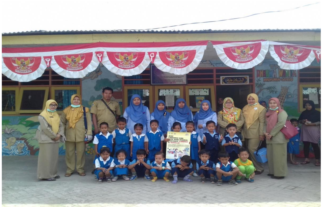
GAMBAR .4 GURU DAN MURID BERSAMA PETUGAS KESEHATAN