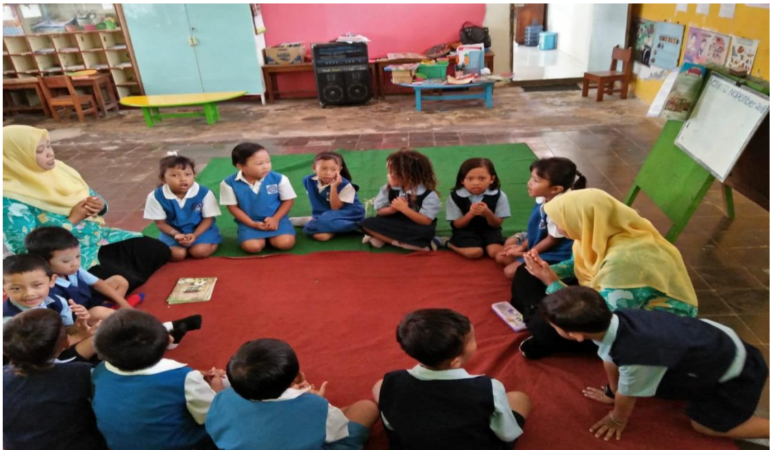
GAMBAR 13 DO'A SEBELUM KEGIATAN