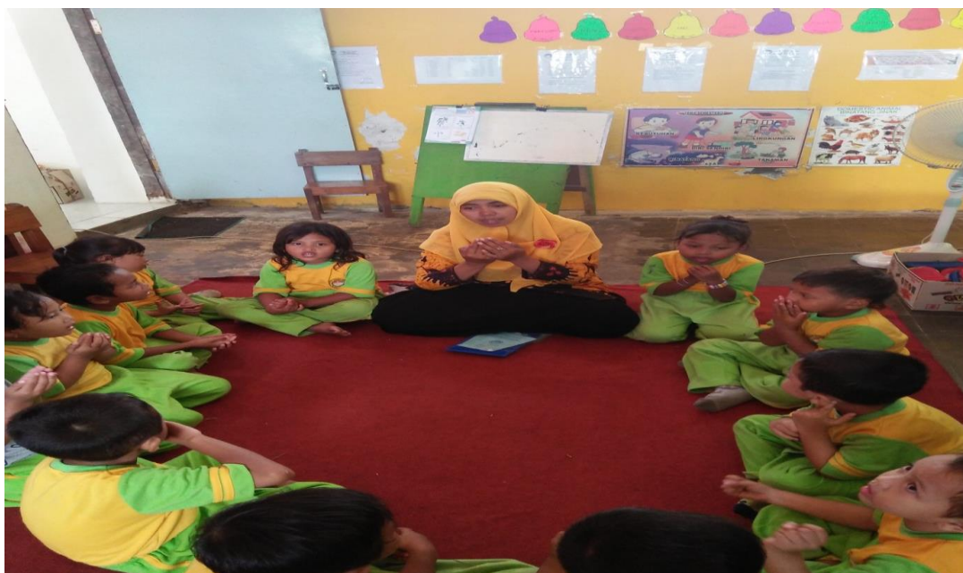
GAMBAR .6 DO'A SEBELUM KEGIATAN