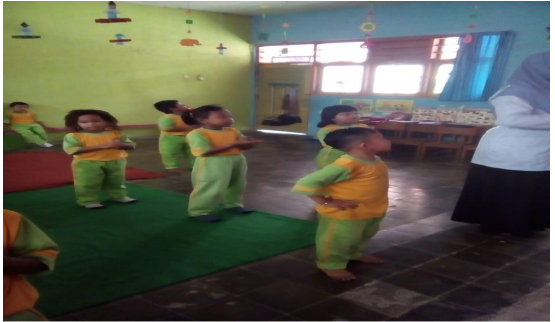
GAMBAR .7 MENIRUKAN GERAK SESUAI IRAMA MUSIK