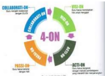
Gambar 2 Empat ON (Sampun et al., 2017)

ON, yakni Visi-ON , acti-ON , passi-ON , Collaborati-ON .