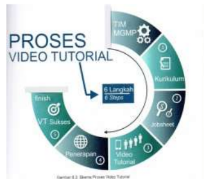
Gambar 1 Proses Video Tutorial (Sampun et al., 2017)

Berikut gambar proses pembuatan video tutorial yang akan digunakan dalam proses pembelajaran.