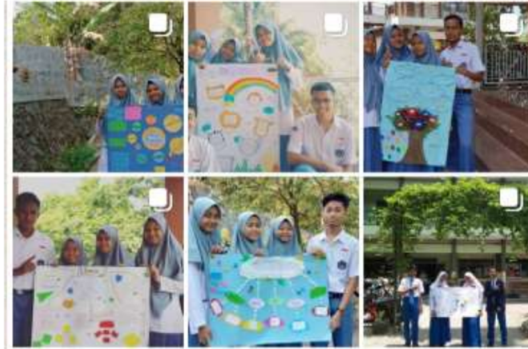
Gambar 4 Pembelajaran Teks Eksposisi

Seperti yang dilakukan oleh salah satu sekolah di Jawa Timur berikut ini.