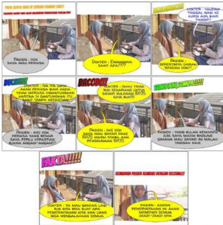
Gambar 3 Pembelajaran Topik Teks Anekdot

Topik bahasan lain, misalnya teks anekdot yang juga bisa dikerjakan dengan metode dramatisasi yang divideokan, hasilnya tampak pada gambar berikut ini.