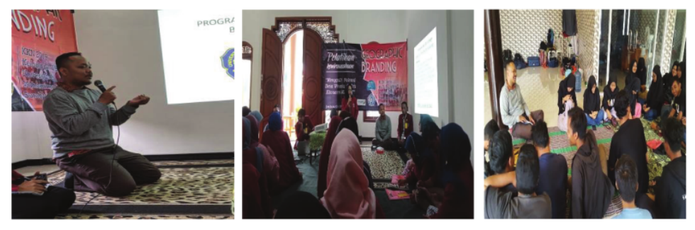
Gambar 1: Sosialisasi Pendampingan hukum bagi UMKM bersama warga Desa Jarak, Kec. Wonosalam, Kab. Jombang

hukum, seperti: perizinan legalitas UMKM berupa: Tanda Daftar Perusahaan (TDP), Surat Izin Usaha Perdagangan (SIUP), Nomor Pokok Wajib Pajak (NPWP), Izin Gangguan, serta Izin Produk Industri Rumah Tangga (P-IRT), dan hal tersebut menjadi perhatian untuk penjualan komoditas barang maupun jasa dalam e-commerce yang secara hukum juga berpotensi dipersyaratkan, sehingga warga Desa Jarak, Kec.Wonosalam, Kab.Jombang memiliki kesadaran hukum untuk mengurus perizinan tersebut.