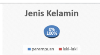
Gambar 3. Distribusi frekuensi Responden Berdasarkan Jenis Kelamin di Panti Griya Werdha Hargodedali Surabaya pada bulan Agustus 2017

16 Berdasarkan gambar 3 diketahui bahwa seluruh responden berjenis kelamin perempuan 100% (30 lansia).