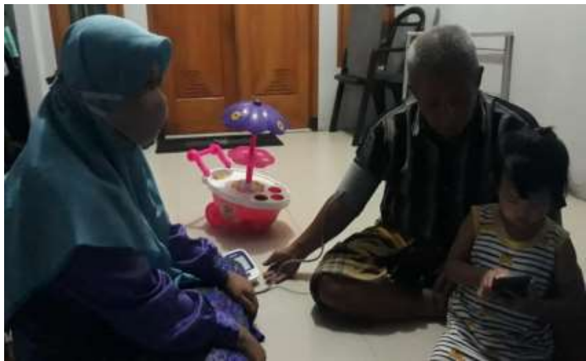
Gambar 6.2 Mengukur tekanan darah responden