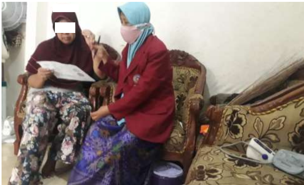
Gambar 6.5 Pelaksanaan Pendidikan kesehatan