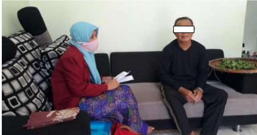
Gambar 6.1 Foto pada saat memberikan penyuluhan kepada