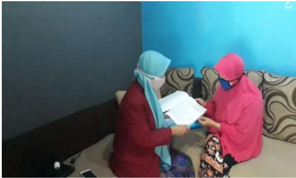
Gambar 6.4 Menjelaskan tujuan penelitian, sebelum diberikan Pendidikan kesehatan