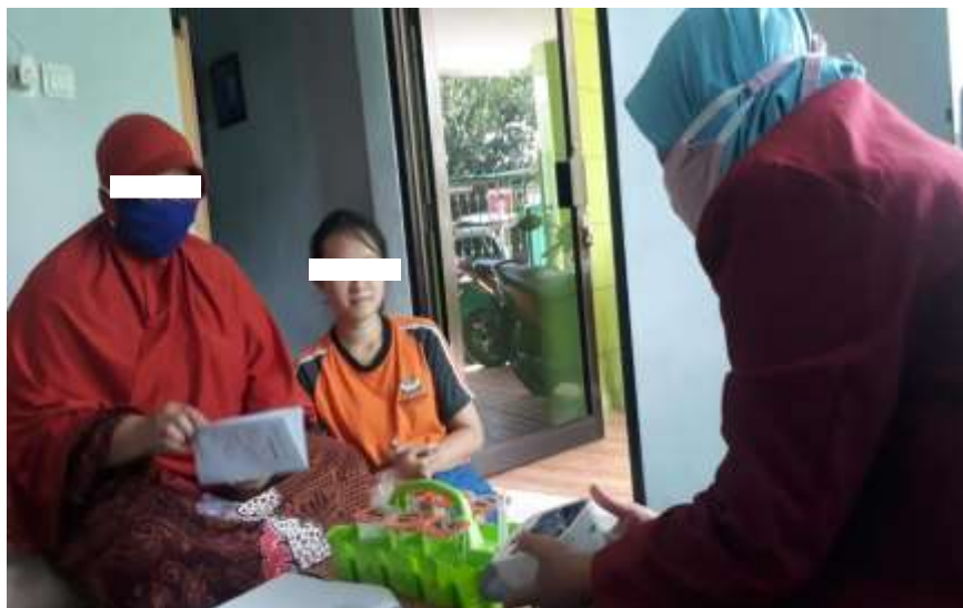
Gambar 6.3 Memberikan leaflet, pada saat memberikan Pendidikan kesehatan