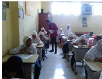
Gambar 2. Pemberian Angket Kepada Siswa