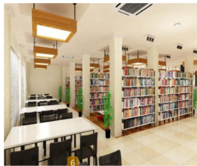
Gambar 1. Perpustakaan dan Ruang Baca (area koleksi buku)