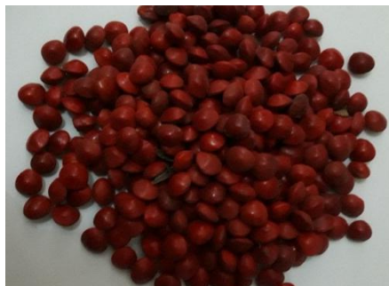
Gambar 2.1. Buah polong saga yang sudah tua

Pada umumnya tinggi tanaman Saga pohon yang tua bisa mencapai 20-30 m. Saga pohon termasuk tanaman deciduos atau berganti daun setiap tahun. Dengan bentuk daun majemuk menyirip genap, tumbuh berseling, jumlah anak daun bertangkai 2 - 6 pasang, helaian daun 6 - 12 pasang, panjang tangkainya mencapai 25 cm, daun berwarna hijau muda (Mumpuni, 2010). Struktur morfologi polong saga yang sudah tua seperti pada Gambar 2.1