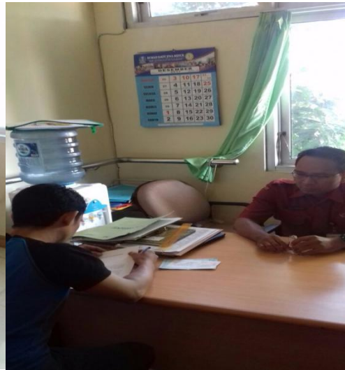
Gambar 1. Pengambilan Data Kuesioner komunitas LSL diPoli VCT RSJ Menur (20-2-2018)