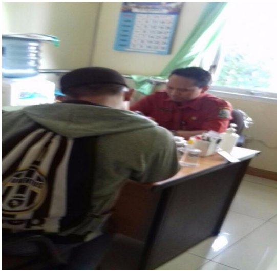
Gambar 1. Pengambilan Data Kuesioner komunitas LSL diPoli VCT RSJ Menur (19-2-2018)