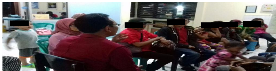
Gambar 5. Penjelasan dan pertanyaan peserta KDS tentang pengobatan HIV di RSJ Menur Surabaya (23-2-2018)