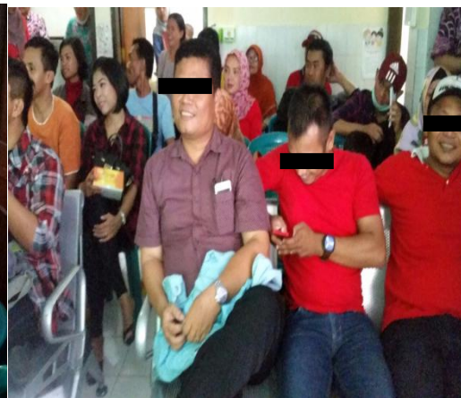
Gambar 4. Suasana Pengambilan Kuesioner dan penjelasan tentang tata cara pengisian (23-2-2018)