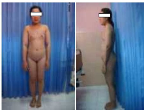
Gambar 2. Gambaran Klinis (Primadina, N 2008)

Pasien MRS tanggal 24 Oktober 2008. Dari pemeriksaan fisik, pada genitalia eksterna didapatkan penis telah disirkumsisi dengan ukuran kecil, panjang 5cm disertai chordae dan meatus uretra externa didaerah penoscrotal, dorsal hook tidak ditemui. Testis tidak teraba pada kedua scrotum dan inguinal.