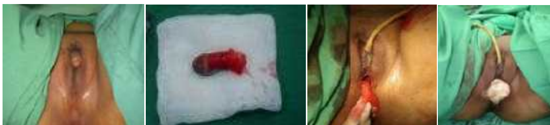
Gambar 6. (kiri ke kanan) Kondisi pre-op, penis yang telah direseksi, neovagina yang telah dibentuk, hasil akhir vaginoplasti yang dipasang tampon (Nprimadina, 2008)

dengan cavum douglas, pangkal urethra direseksi, kulit preputium digunakan untuk menutup defek sisi anterior. Reseksi diantara perineum dan urethra diperdalam sampai dengan cavum douglas. Dilakukan pemasangan kapas dalam kondom yang dilapisi skin graft dari donor di paha kiri dan difiksasi dengan silk 2.0.(McIndoe, A 1950)