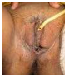
Gambar 7. Hasil evaluasi graft (Nprimadina, 2008)

Hasil akhir secara keseluruhan pada pasien ini sangat memuaskan, bentuk neovagina yang mendekati normal, graft hidup, dan tidak ada komplikasi stenosis atau fistel.