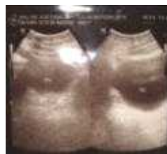
Gambar 5. Hasil USG (Nprimadina, N 2008)

Dan hasil evaluasi psikologi pasien dapat dipertimbangkan untuk menjalani operasi ubah kelamin (transeksual).