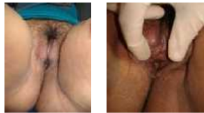
Gambar 8. Hasil Mc Indoe vaginoplasty setelah 3 bulan post op (Nprimadina, 2009)

Setelah operasi dilakukan perawatan luka operasi setiap 3 hari, dan stent kondom dipertahankan sampai 10 hari post op. Telah dilakukan evaluasi graft pada hari ke-5 post operasi dan hasilnya graft hidup 100%, tidak dijumpai pus.