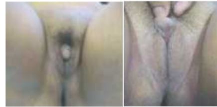
Gambar 4. Fenotip Pasien (Primadina, N 2008)

Pada hasil pemeriksaan uji karyotipe tanggal 7 Juli 2008 didapatkan karyotipe 46,XY, hasil pemeriksaan hormonal sesuai dengan jenis kelamin laki-laki dan hasil pemeriksaan USG urologi dan inguinal tanggal 9 Juni 2008 tidak didapatkan bentukan testis pada inguinal D dan S dan didapatkan bentukan menyerupai uterus atau prostat pada posterior buli. Pasien didiagnosa dengan Sex Ambigua tipe Male Pseudohermaprodit.