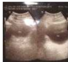
Gambar 5. Hasil USG (Nprimadina, N 2008)

Dan hasil evaluasi psikologi pasien dapat dipertimbangkan untuk menjalani operasi ubah kelamin (transeksual).