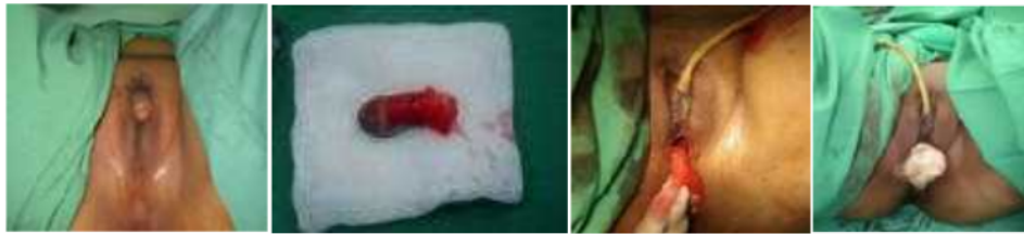
Gambar 6. (kiri ke kanan) Kondisi pre-op, penis yang telah direseksi, neovagina yang telah dibentuk, hasil akhir vaginoplasti yang dipasang tampon (Nprimadina, 2008)

dengan cavum douglas, pangkal urethra direseksi, kulit preputium digunakan untuk menutup defek sisi anterior. Reseksi diantara perineum dan urethra diperdalam sampai dengan cavum douglas. Dilakukan pemasangan kapas dalam kondom yang dilapisi skin graft dari donor di paha kiri dan difiksasi dengan silk 2.0.(McIndoe, A 1950)