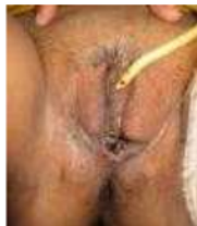
Gambar 7. Hasil evaluasi graft (Nprimadina, 2008)

Hasil akhir secara keseluruhan pada pasien ini sangat memuaskan, bentuk neovagina yang mendekati normal, graft hidup, dan tidak ada komplikasi stenosis atau fistel.