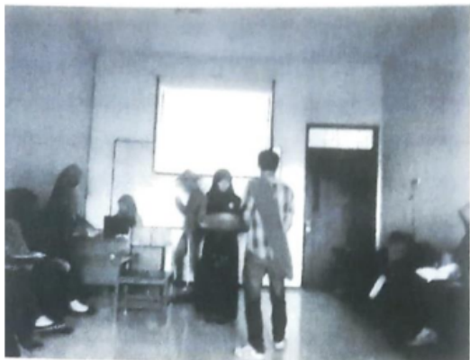
Gambar 1 Mahasiswa bermain peran "bencana gunung meletus"

suatu lakuan, baik dialog maupun monolog guna menghadirkan peristiwa dan rangkaian cerita tertentu (PLPG 2021).