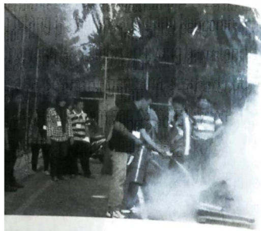
Gambar 2 Mahasiswa mempraktekkan cara memadamkan api dengan "APAR"

Disamping itu mahasiswa belum memiliki kesiapsiagaan menghadapi bencana, artinya meskipun mahasiswa sudah memiliki pengetahuan tentang bencana tetapi tidak semuanya tahu apa yang harus dilakukan jika terjadi bencana sesuai standar operasional system dan cara untuk menolong masyarakat korban bencana.