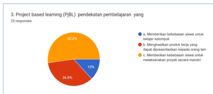
Gambar 2. Pendekatan Pembelajaran PjBL

Project Based Learning (PjBL) pendekatan pembelajaran yang menghasilkan produk kerja yang dapat dipresentasikan kepada orang lain, di jawab benar oleh 34,8% responden. Sedangkan jawaban salah diberikan oleh 52,2% responden menjawab dengan memberikan kebebasan siswa untuk melaksanakan proyek secara mandiri dan 13% menjawab memberikan kebebasan siswa untuk belajar kelompok.