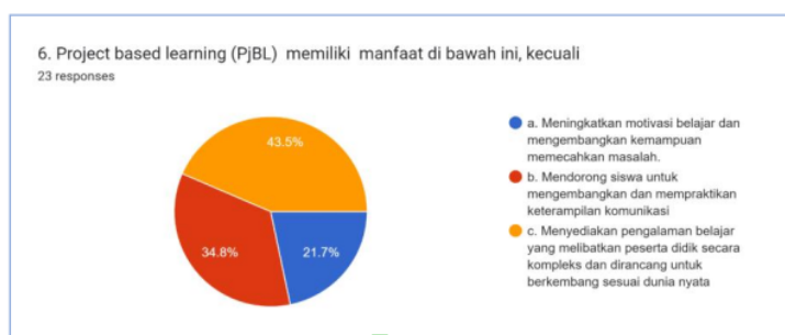
Gambar 4. Manfaat Project Based Learning (PjBL)

Project Based Learning (PjBL) memiliki manfaat di bawah ini, hal ini dipahami oleh 21,7% persen, yaitu: Mendorong siswa untuk mengembangkan dan mempraktikkan keterampilan komunikasi dan menyediakan pengalaman belajar yang melibatkan peserta didik secara kompleks dan dirancang untuk berkembang sesuai dunia nyata .