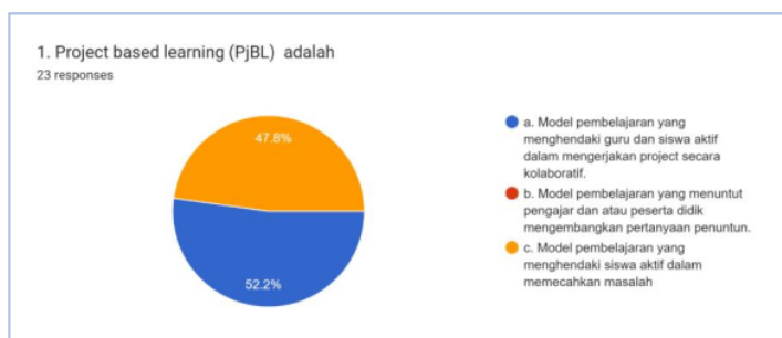
Gambar 1. Pengertian Project Based Learning (PjBL)

Project Based Learning (PjBL) pendekatan pembelajaran yang menghasilkan produk kerja yang dapat dipresentasikan kepada orang lain, di jawab benar oleh 34,8% responden. Sedangkan jawaban salah diberikan oleh 52,2% responden menjawab dengan memberikan kebebasan siswa untuk melaksanakan proyek secara mandiri dan 13% menjawab memberikan kebebasan siswa untuk belajar kelompok.