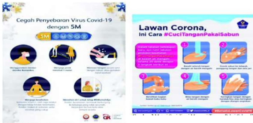
Gambar 4.1 Materi Edukasi pencegahan Covid 19

Kegiatan Pengabdian kepada masyarakat dengan judul “Edukasi Pencegahan Covid-19 Melalui Kegiatan 5M” dilaksanakan dengan memberikan materi kepada masyarakat terkait informasi terkait perkembangan virus Covid-19 di Desa Gunung Dawarblandong Mojokerto. Selain menggunakan powerpoint ada beberapa video dan gambar sebagai media dalam menunjang penjelasan ke masyarakat terkait pencegahan virus Covid-19 antara lain video cara mencuci tangan baik dengan air dan hand sanitizer , menjaga jarak, memakai masker, mengurangi mobilitas dan menjauhi kerumunan sesuai anjuran pemerintah.