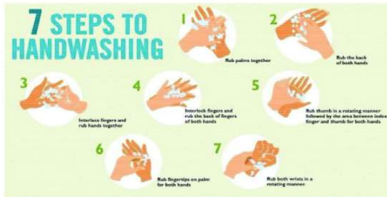
Gambar 2.1 langkah Cuci tangan

Berikut adalah gambar cara mencuci tangan dan pemakaian cairan pembersih tangan yang benar sesuai dengan anjuran WHO.