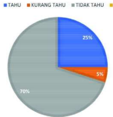
Gambar 1.2 Diagram Pemahaman Pencegahan Covid-19