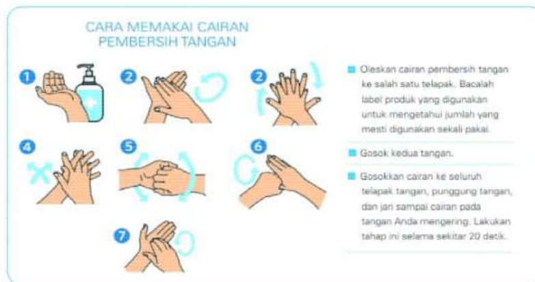
Gambar 2.2 Langkah cuci tangan menggunakan handsanitizer