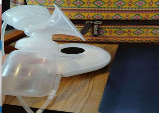
Gambar 2. Alat pompa Asi

Cara menyimpan ASI di tempat kerja dengan menggunakan botol kaca atau dengan plastic khusus ASI, cara membawa ASI perah dari tempat kerja ke rumah dengan menggunakan cooler bag yang sudah diisi es batu atau ice gel, cara penyimpanan ASI sampai rumah dimasukkan ke lemari pendingin selama 1 jam sebelum dimasukkan dalam freezer, lama penyimpanan ASI Perah lemari es/kulkas 3-8 hari dengan suhu 0-4C, freezer 2 minggu didalam freezer lemari es 1 pintu, 3-4bulan difreezer pada lemari es 2 pintu. Cara menyajikan ASI perah dengan prinsip first in first out dikeluarkan secara berurutan dari jam perah. Turunkan ASI dari freezer ke lemari pendingin sehari sebelum agar pencairan ASI yang beku bertahap dan tidak merusak kandungan ASI. ASI dihangatkan dengan cara merendam botol yang berisi ASI perah dalam wadah yang berisi air pada suhu ruangan lalu diganti dengan air yang lebih hangat (Supinganto, 2021)