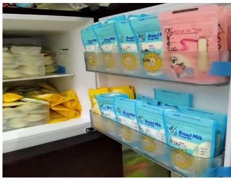
Gambar 1. Penyimpanan Asi