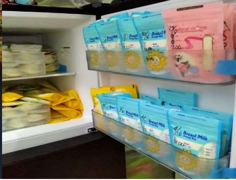
Gambar 1. Penyimpanan Asi