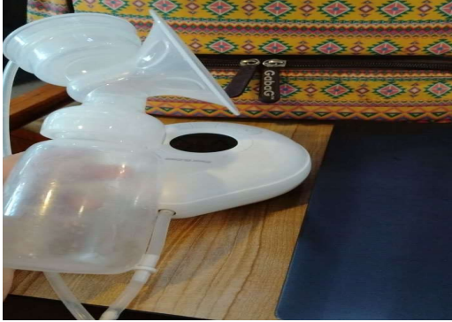
Gambar 2. Alat pompa Asi