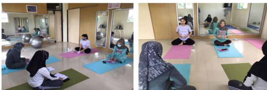
Gambar 2. Prenatal Yoga