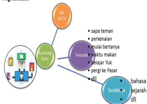
Gambar 1. Tampilan Nemo Sesuai Desain Aplikasi