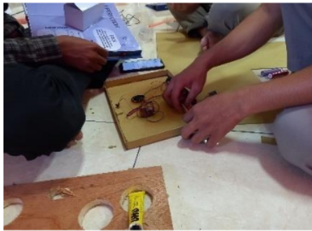
Gambar 4. Proses Pembuatan Media Magical Book Geometry Voice Interaction