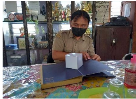
Gambar 5. Koordinasi dan Validasi Media Magical Book Geometry Voice Interaction