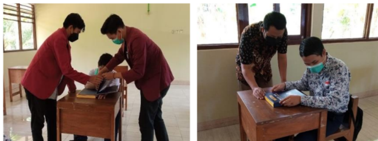
Gambar 6. Implementasi Media Magical Book Geometry Voice Interaction