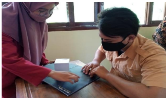
Gambar 6. Penempatan textbraille pada Media Magical Book Geometry Voice Interaction

Media pembelajaran Magical Book Geometry Voice Interaction dibuat dari kertas yang memiliki nilai ketahanan yang kuat untuk pembelajaran siswa penyandang disabilitas. Oleh karena itu, Selain itu, dalam pembuatan audio akan diberikan space pengisi suara, tombol power serta text braille yang dapat memudahkan siswa penyandang tunanetra dalam mengikuti pembelajaran.