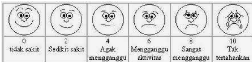
Gambar 1.3 Skala Wajah Wong-Bakers.(Uliyah, 2012)

VAS memodifikasi penggantian angka dengan kontinum wajah yang terdiri dari enam wajah dengan profil kartun yang menggambarkan wajah dari yang sedang tersenyum (tidak merasakan nyeri), kemudian kurang bahagia, wajah yang sangat sedih, sampai wajah yang sangat ketakutan (sangat nyeri).