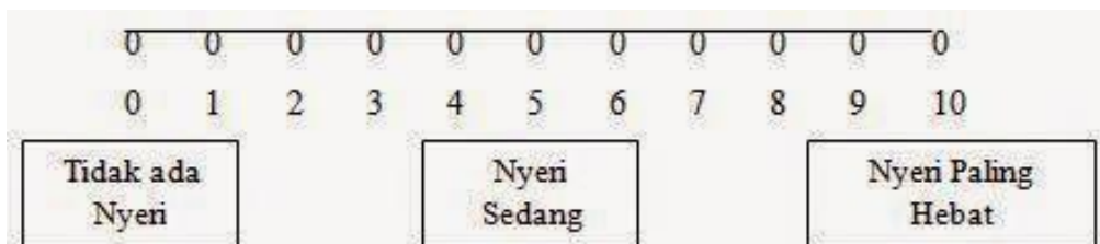
Gambar 2.1 Skala Numerik 0 – 10