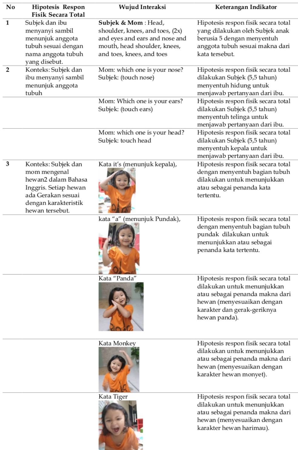
Tabel 4. Hipotesis Respon Fisik secara Total (dokumen peneliti) 2022