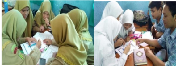
Gambar 1 Siswa Menganalisis LKS Tipe TGT-HOTS

aktivitas siswa dalam 4 pembelajaran kooperatif tipe TGT-HOTS diyanayakan “Efektif”. Aktivitas siswa dalam pembelajaran kooperatif tipe TGT-HOTS disajikan pada gambar 1 dan 2 berikut.