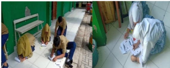
Gambar 2 Siswa Mengevaluasi LKS Tipe TGT-HOTS