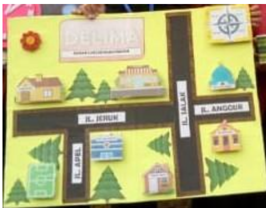
Gambar 1 Media Delima

Pentingnya penggunaan media pembelajaran juga dijelaskan dalam kerucut pengalaman Edgar Dale pada gambar di bawah. Adapun kerucut pengalaman Edgar Dale dapat dilihat pada gambar di bawah ini.