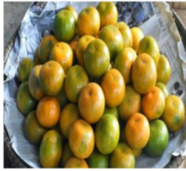
Gambar 2.1 Buah Jeruk Manis

Rumusan Masalah penelitian ini adalah apakah ada pengaruh efektifitas lama perendaman serbuk kulit jeruk manis ( Citrus sinensis ) terhadap bilangan peroksida pada minyak jelantah?