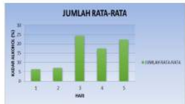
Gambar 1. Grafik 4.1 Diagram Batang Pengaruh Lama Penyimpanan Buah Nangka ( Artocarpus heterophyllus Lam. ) Pada lemari Es Terhadap Kadar Alkohol (%)

Dari hasil tabel 1, diperoleh kadar alkohol pada buah nangka ( Artocarpus heterophyllus Lam ) penyimpanan hari ke-1 adalah 6,39 %, hari ke-2 adalah 7,15 %, hari ke-3 adalah 24,32 %, hari ke-4 adalah 17,61 % dan hari ke-5 adalah 22,28 %. Kadar alkohol terbesar pada nangka ( Artocarpus heterophyllus Lam ) penyimpanan hari ke-3 adalah 24,32 % dan kadar alkohol terkecil pada penyimpanan hari ke-1 adalah 6,39 %.