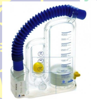
Gambar 3.1 Alat Spirometri (Numbery,2012)

Alat spirometri digunakan untuk memeriksa kapasitas vital paru yang digunakan sebagai alat ukur selama percobaan berlangsung. Alat spirometri yang digunakan dalam penelitian ini adalah “Spiro Ball” dan cara penggunaannya adalah sebagai berikut :