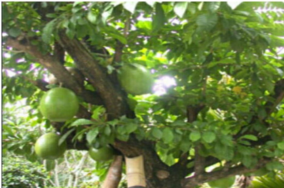
Gambar 2.2 : Tumbuhan Majapahit (Asmaedah, 2011)