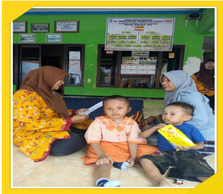
Gambar 7 : Wawancara Wali Murid PPT Ceria Bunda Tanggal 28 Februari 2019