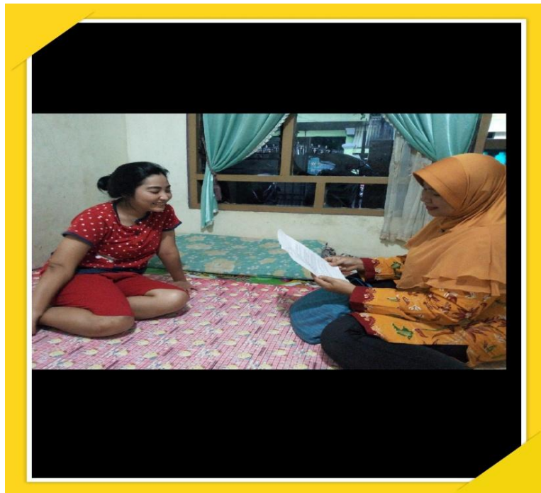
Gambar 8 : Wawancara Wali Murid PPT Mekar Sari Tanggal 28 Februari 2019