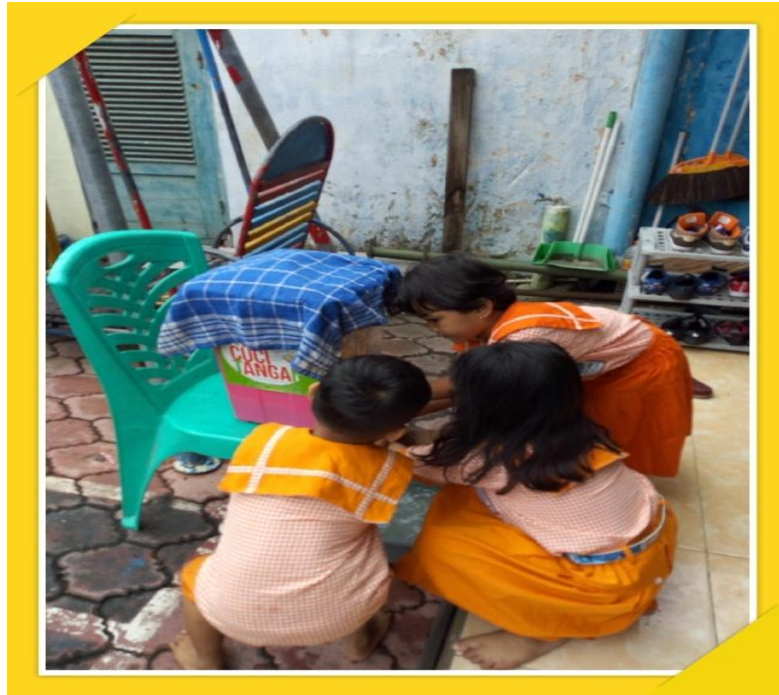
Gambar 1 : Kegiatan Cuci Tangan Setelah Pembelajaran Di PPT Ceria Bunda Tanggal 04-02-2019