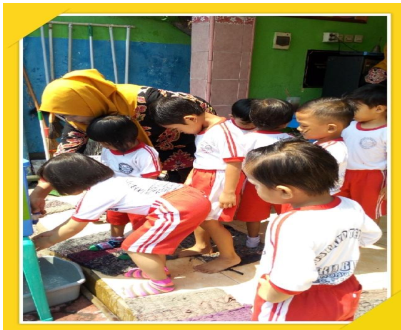
Gambar 2 :Bunda Memberi Contoh Cuci Tangan Tanggal 12-02-2019