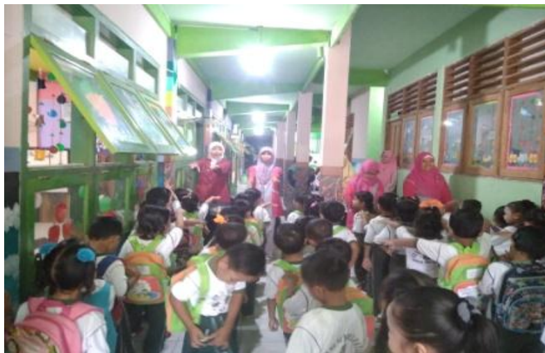
Gambar 8. Kegiatan Salam dan Ikrar