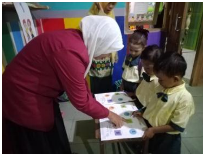
Gambar 4. Kegiatan Inti 2 (Anak bermain mencari jejak)