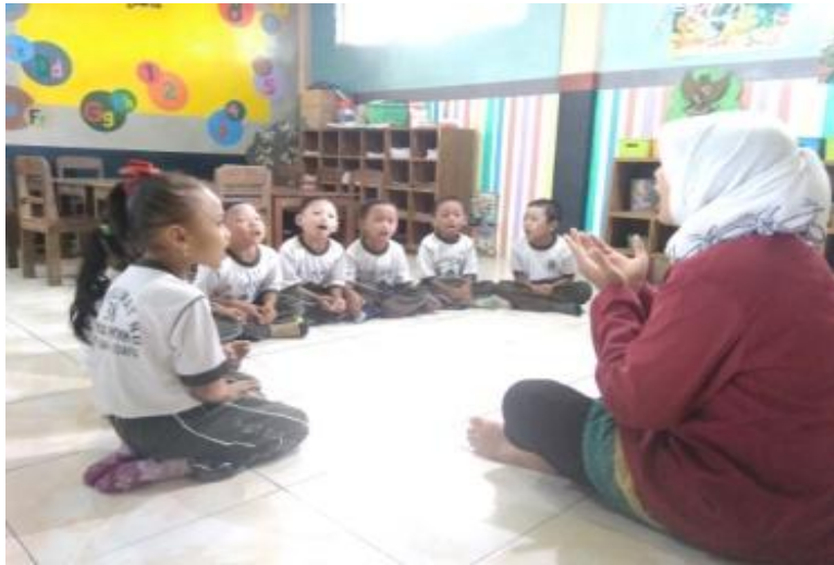
Gambar 9. Kegiatan Doa