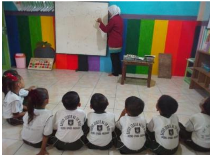
Gambar 10. Kegiatan Inti 1 (guru memberi penjelasan materi pembelajaran)