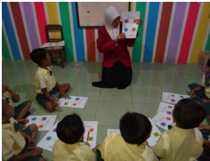
Gambar 2. Kegiatan Inti 1 (Guru menjelaskan materi pembelajaran)