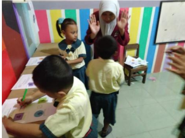
Gambar 3. Kegiatan Inti 2 (Anak bermain mencari jejak)