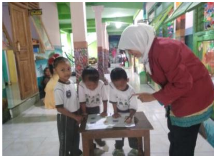
Gambar 14. Kegiatan Inti 2 (Kegiatan mencari jejak)