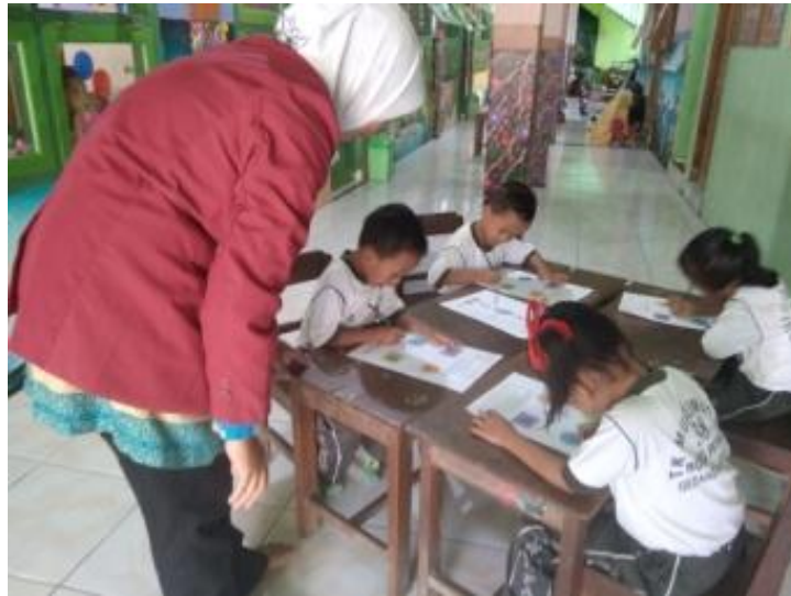
Gambar 13. Kegiatan Inti 2 (Kegiatan mencari jejak)