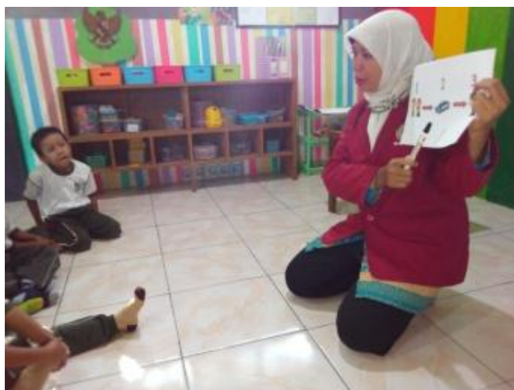
Gambar 11. Kegiatan Inti 1 (Guru menjelaskan materi pembelajaran)