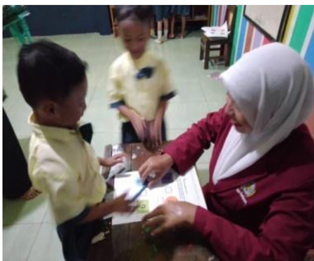
Gambar 6. Kegiatan Inti 2 (Anak bermain mencari jejak)