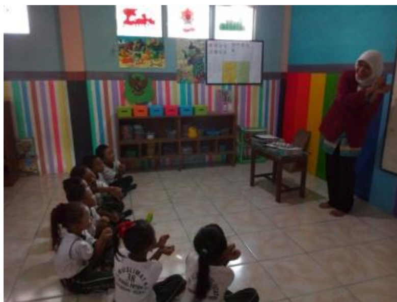
Gambar 12. Kegiatan Inti 1 (Guru menjelaskan materi pembelajaran)