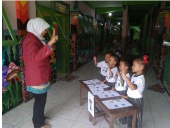
Gambar 15. Kegiatan inti 2 (kegiatan bermian mencari jejak)