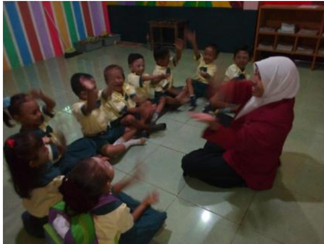
Gambar 1. Kegiatan Pembuka (guru memberi apersepsi)