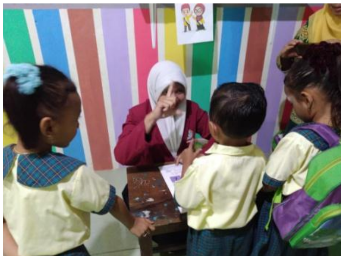
Gambar 5. Inti 2 (Anak bermain mencari jejak)