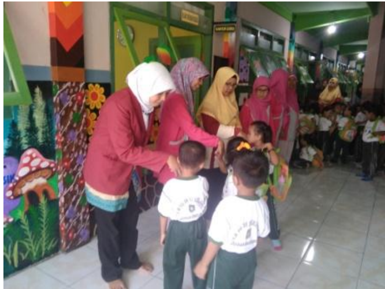
Gambar 7. SOP Penyambutan