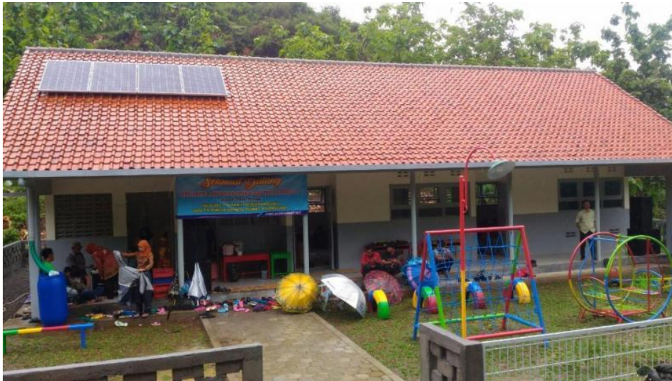
TK Dharma Wanita Persatuan 2 Pakisaji Malang