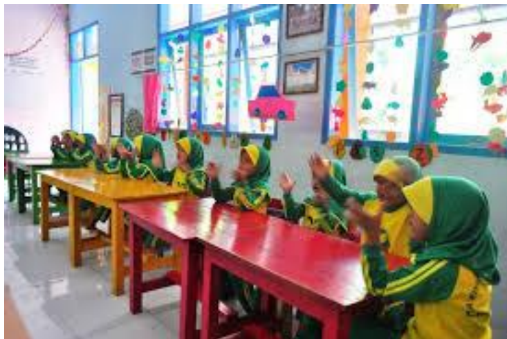
Suasana Belajar TK Dharma Wanita Persatuan 2 Pakisaji Malang