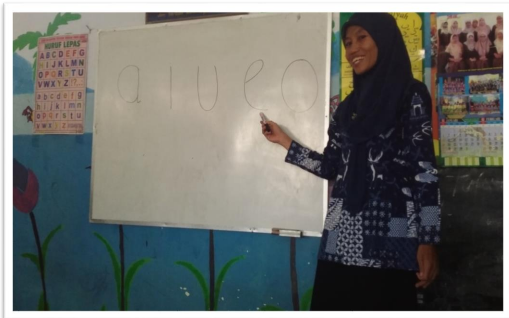
Gambar 2. Kegiatan Inti Pengenalan Huruf Vokal