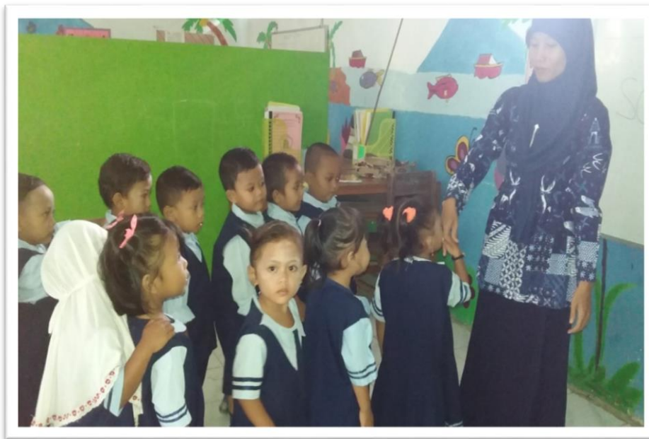
Gambar 4. Kegiatan Akhir Bersalaman Ketika Akan Pulang