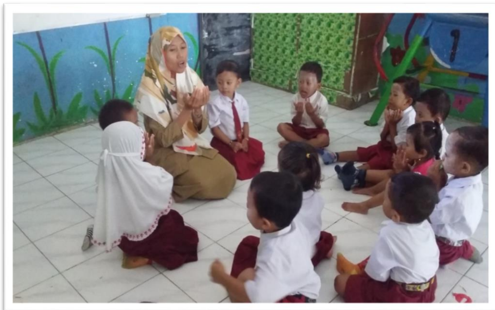
Gambar 2. Berdo'a Sebelum Kegiatan Dimulai