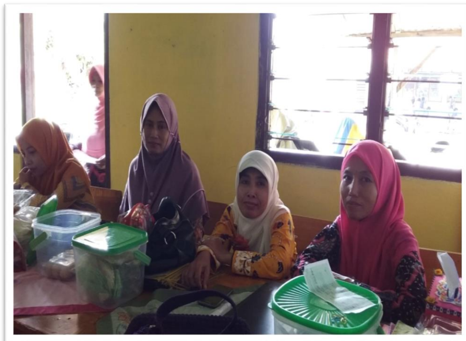
Gambar.2 Foto Bersama Teman Sejawat