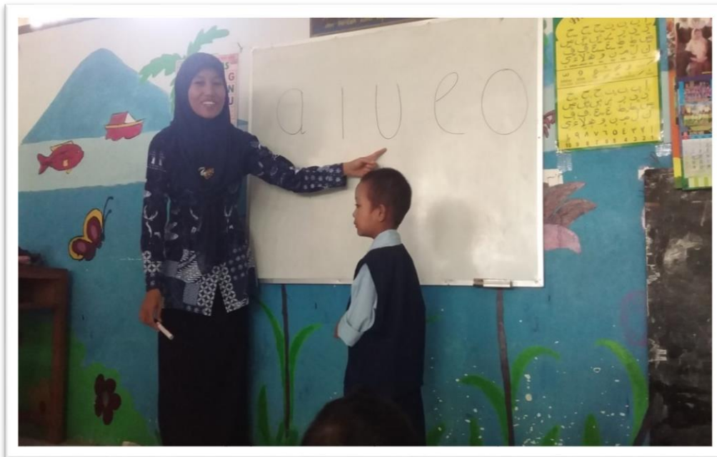
Gambar 3. Tanya Jawab Huruf Vokal