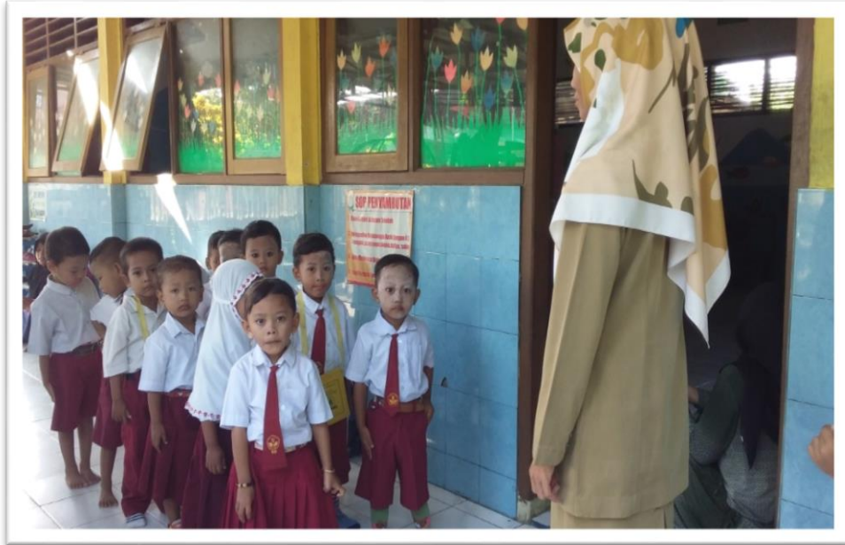
Gambar 1. Berbaris Di Depan Kelas