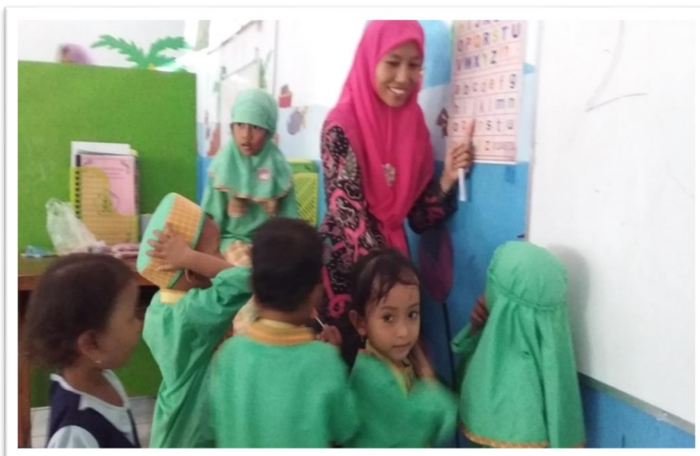
Gambar 4. Kegiatan Akhir Tanya Jawab Ketika Akan Pulang