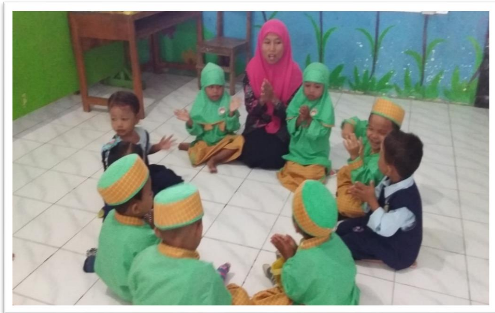
Gambar 1. Do'a Bersama Sebelum Kegiatan