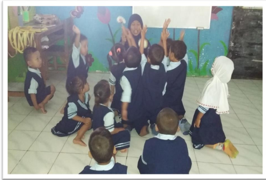
Gambar 3. Kegiatan Pembelajaran Pengenalan Huruf Vokal Melalui Permainan Wayang Mini