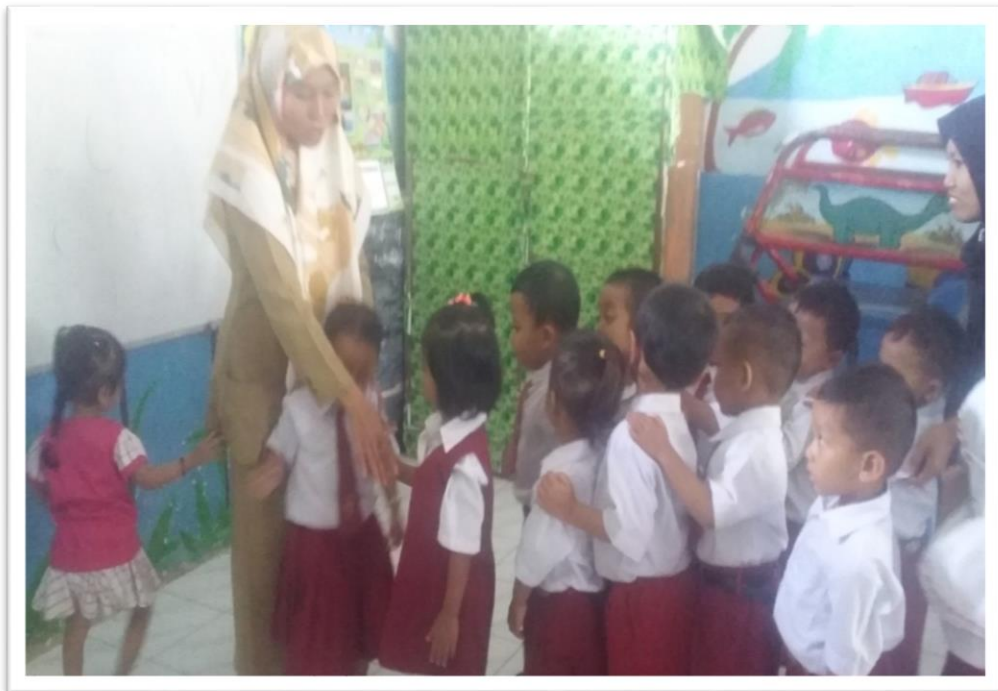
Gambar 4. Kegiatan Akhir Bersalaman Ketika Akan Pulang