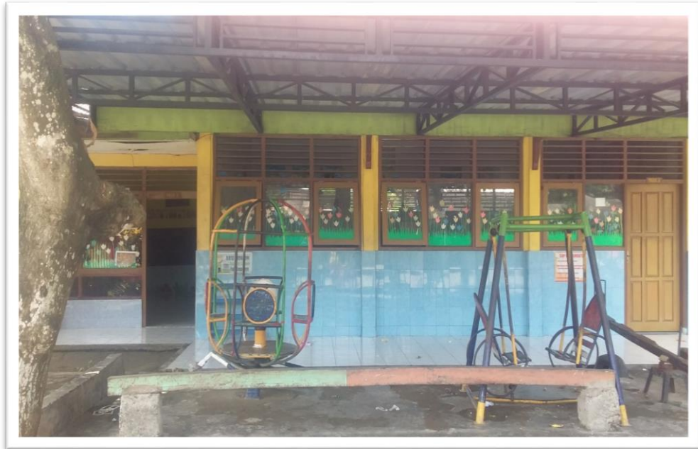
Gambar.1 Lembaga Kelompok Bermain Permata Indah Tebuwung