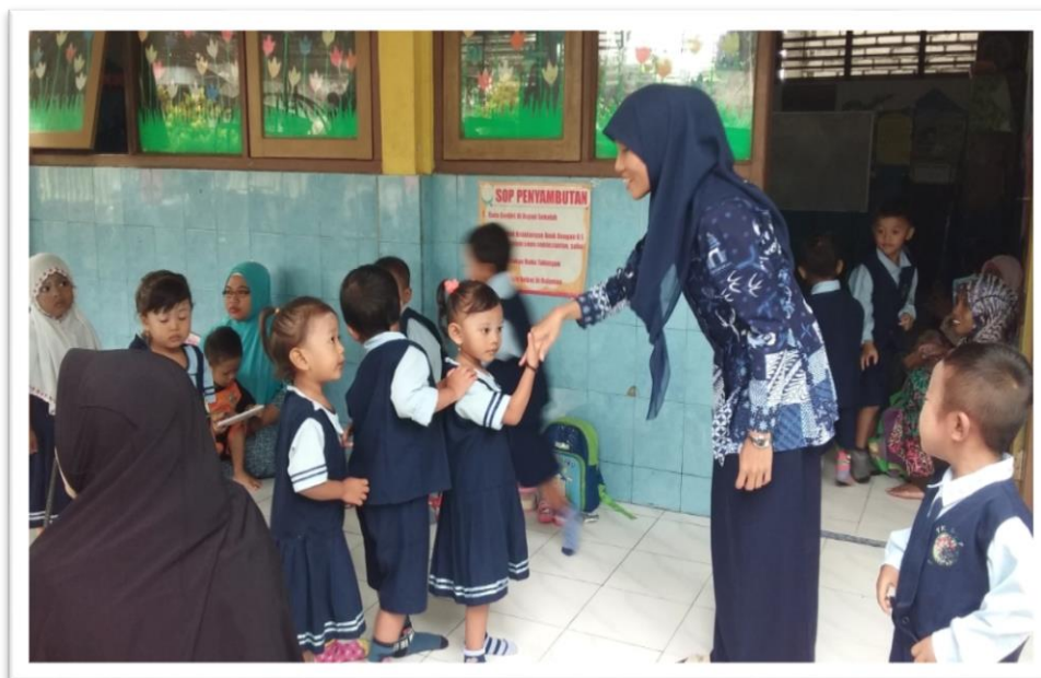
Gambar 1. Berbaris Didepan Kelas