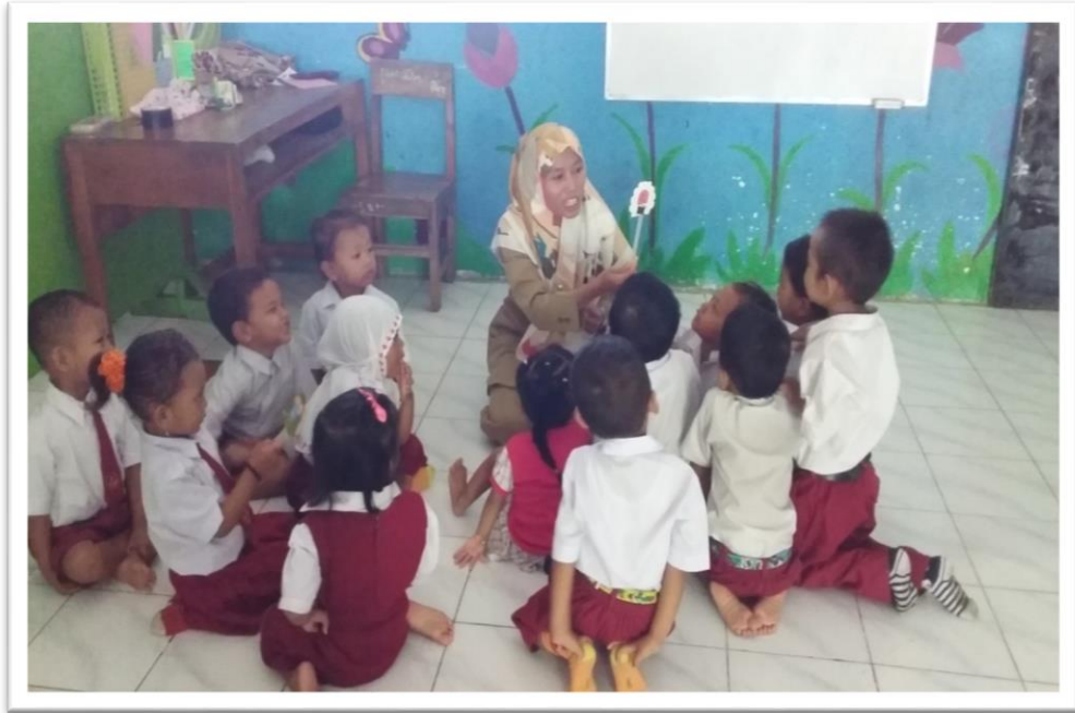
Gambar 3. Kegiatan Pengenalan Huruf Vokal Melalui Permainan Huruf Vokal