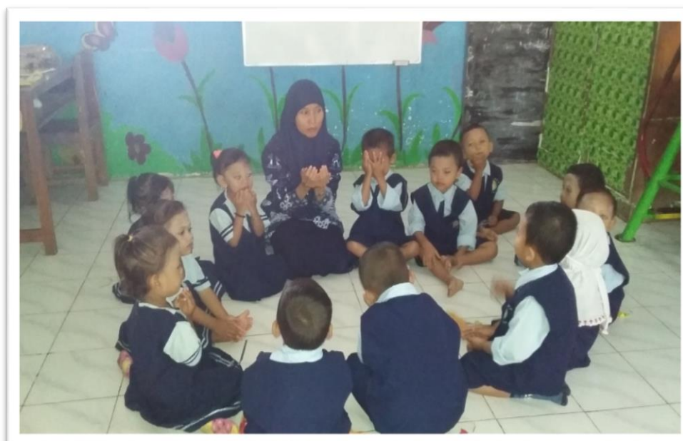
Gambar 2. Berdo'a Sebelum Kegiatan Dimulai