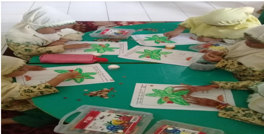
Gambar 9. Kegiatan anak pada saat mulai mengkolase gambar