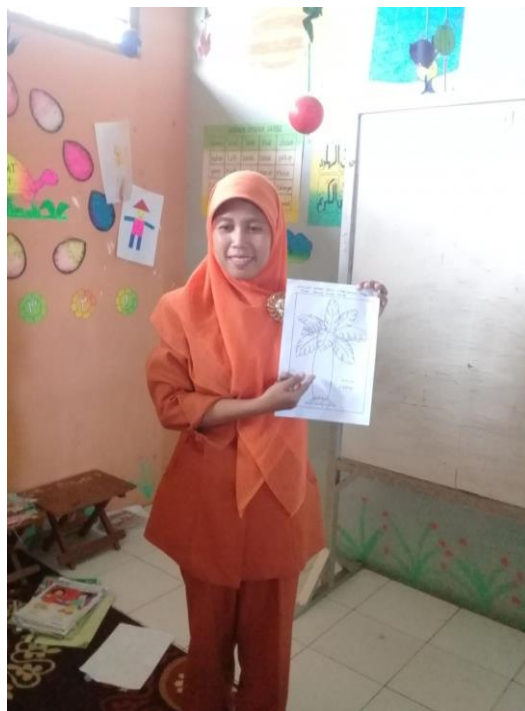
Gambar 5. Guru menjelaskan tentang gambar yang akan di kolase (Pohon Pisang)