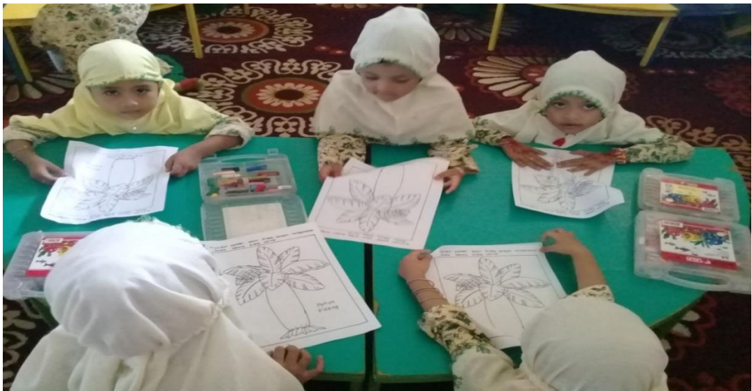
Gambar 7. Guru membagikan lembar kegiatan yang akan dikolase dan bahan-bahan yang digunakan untuk mengkolase