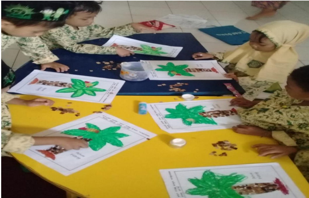
Gambar 12. Anak menyelesaikan tugasnya sendiri tanpa bantuan orang lain