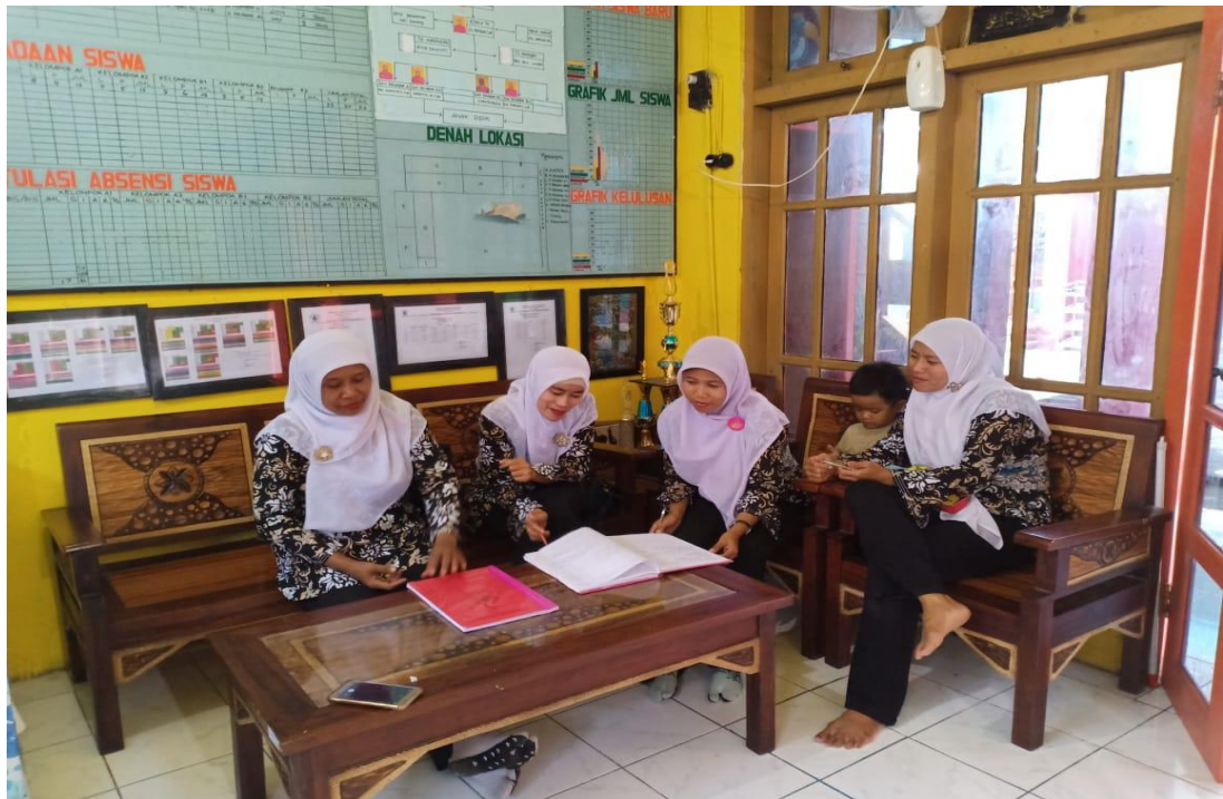
Gambar 3. Kegiatan Refleksi Siklus 2