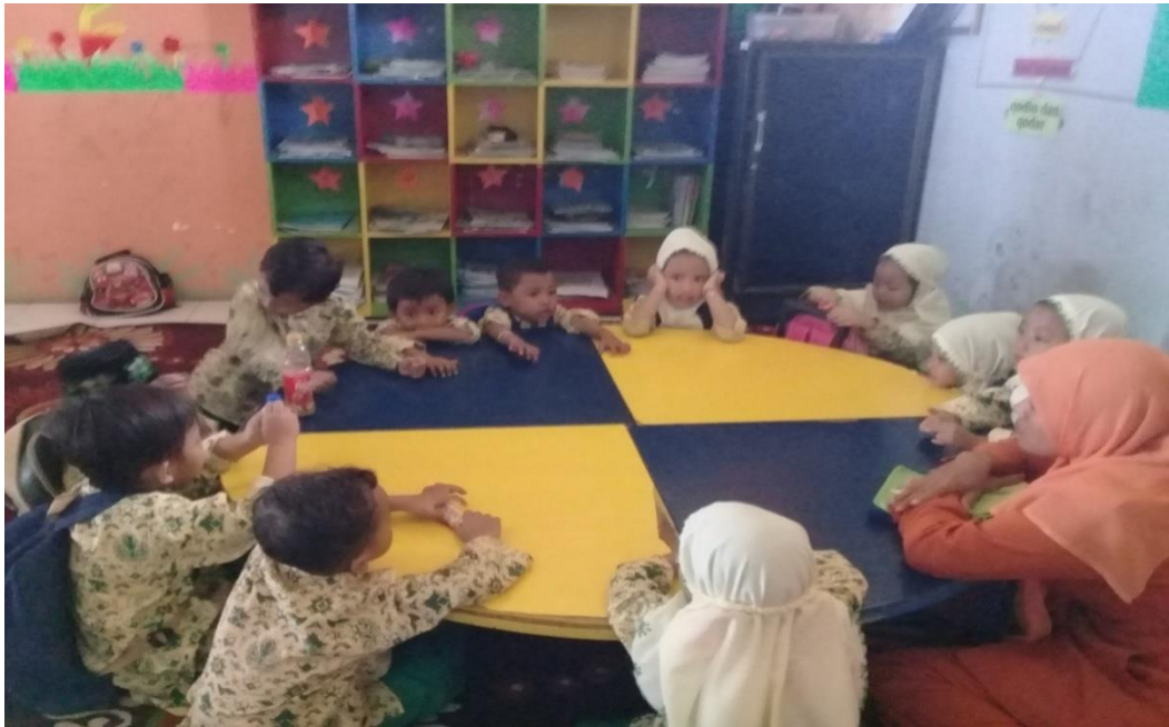
Gambar 14. Kegiatan penutup, ( do'a selsei kegiatan, do'a pulang, salam )