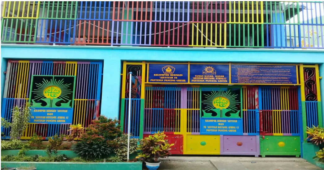
Gambar 1. Foto lembaga TK 'Aisyiyah Bustanul Athfal 12 Pantenan Panceng Gresik