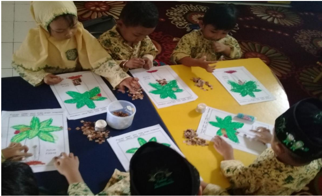
Gambar 10. Anak senang, gembira, semangat dan antusias pada saat menempel dan menyusun potongan-potongan pelepah batang pisang kering pada gambar pohon pisang