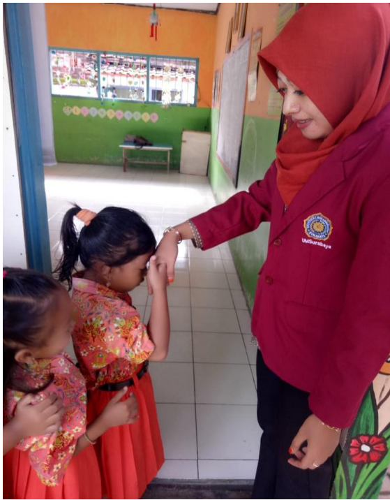
* Menyambut Siswa Datang