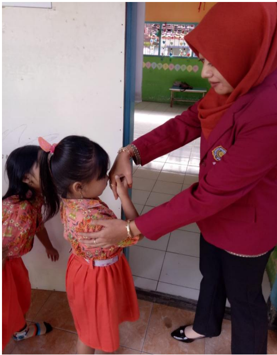
* Menyambut Siswa Datang