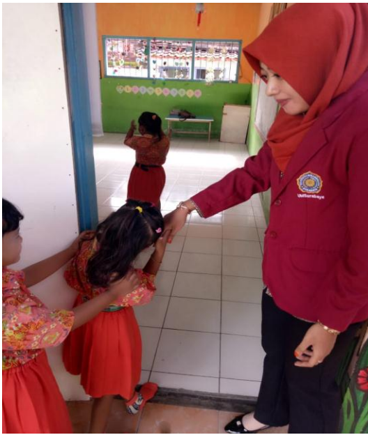
* Menyambut Siswa Datang