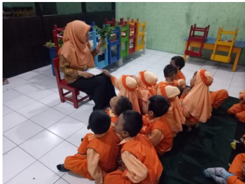
Guru menjelaskan tentang bentuk, warna dan manfaat daun ketela