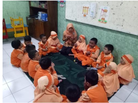
Kegiatan anak-anak berdo'a