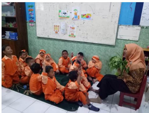
Guru menjelaskan tentang bentuk, warna dan manfaat daun kangkung