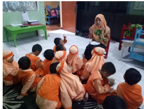
Guru mengajak anak-anak menghitung daun ketela