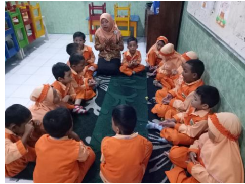
Kegiatan anak-anak berdo'a