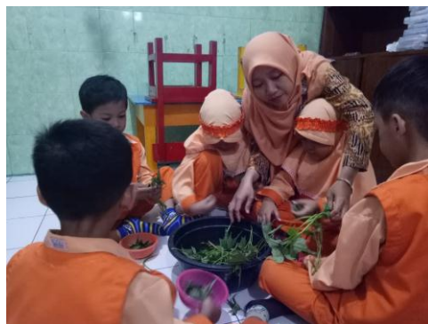
Kegiatan anak-anak menghitung daun ketela sebanyak 7 helai daun