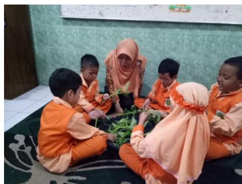
Kegiatan anak-anak menghitung daun kangkung sebanyak 7 helai daun