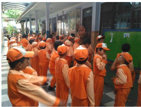
Kegiatan pembiasaan (baris-berbaris)