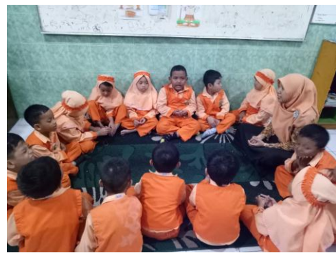
Kegiatan anak-anak berdo'a