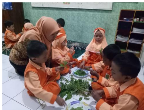
Kegiatan anak-anak menghitung daun bayam sebanyak 7 helai daun