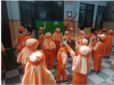
Kegiatan pembiasaan (baris-berbaris)