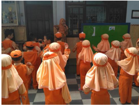
Kegiatan pembiasaan (baris-berbaris)