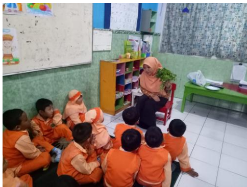
Guru menjelaskan tentang bentuk, warna dan manfaat daun bayam