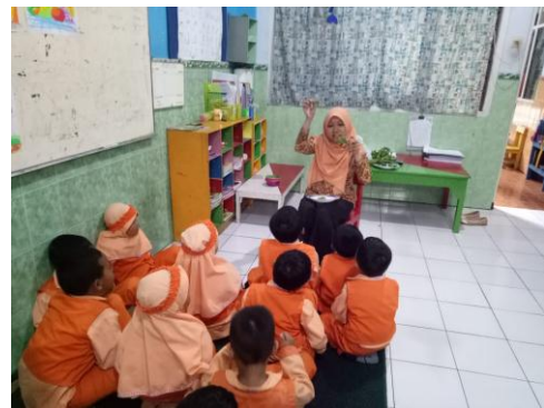
Guru mengajak anak-anak menghitung daun bayam