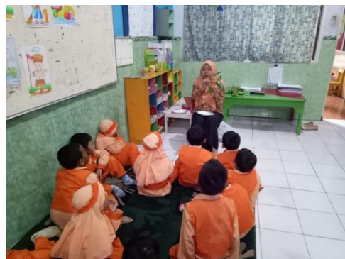
Guru mengajak anak-anak menghitung daun kangkung