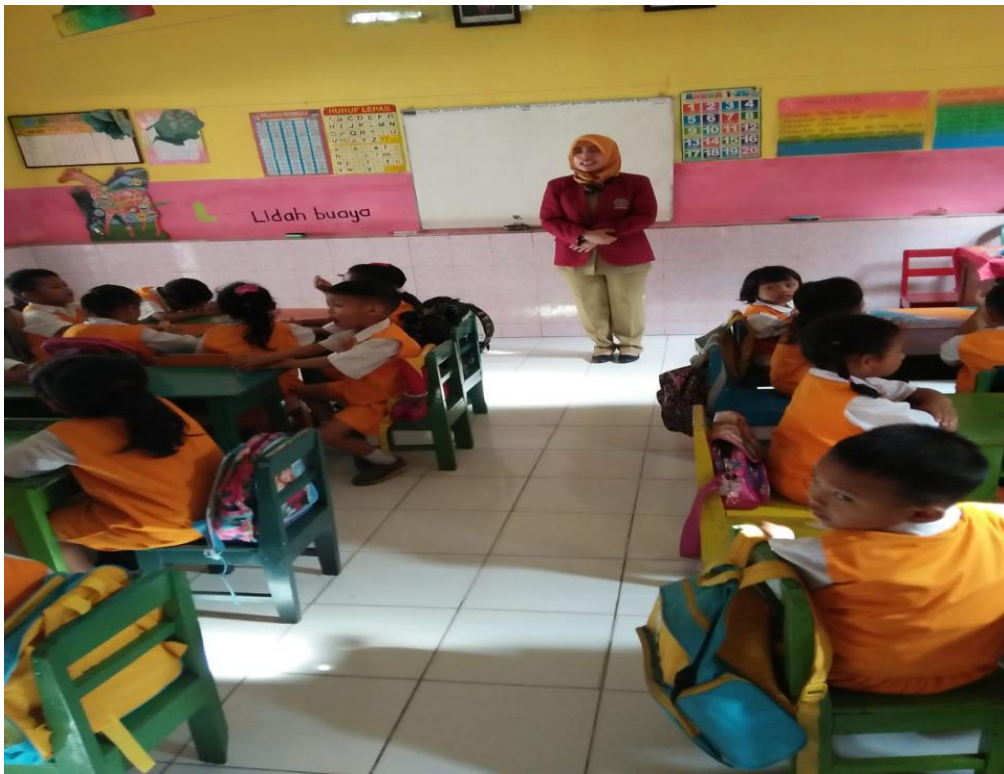
Kegiatan berdoa sebelum pembelajaran