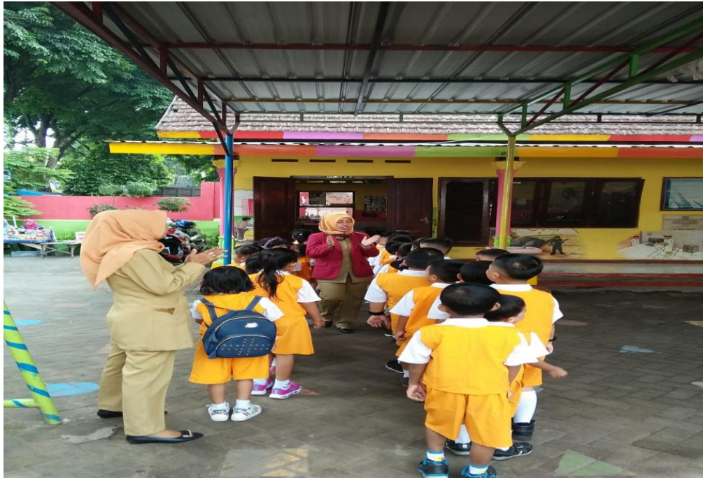
Kegiatan berbaris sebelum masuk kelas