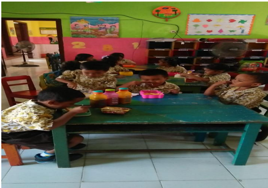
Kegiatan makan bersama