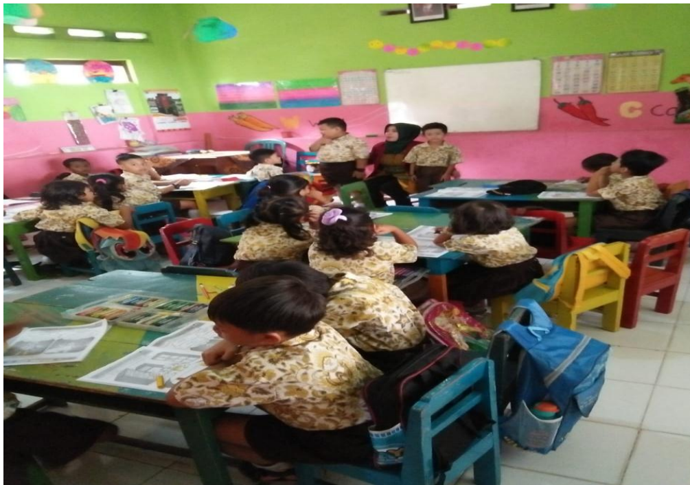
Kegiatan bercakap-cakap tentang kebersihan rumah