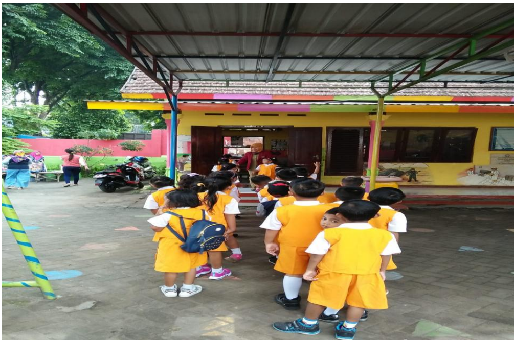
Kegiatan berbaris sebelum masuk kelas