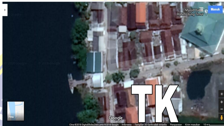
Gambar: 3.2 Tempat Lokasi Penelitian