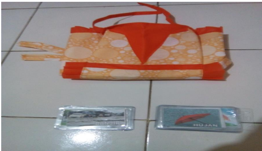
Gambar 1. Alat atau Media Penelitian Siklus II