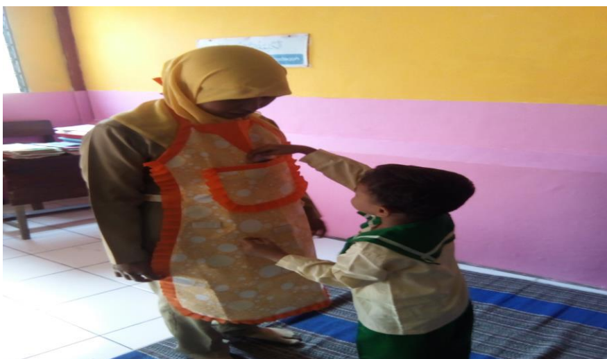
Gambar 2. Kegiatan mengambil kartu kata pada siklus II