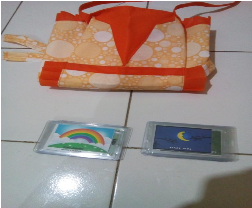
Gambar 1. Alat atau Media Penelitian Siklus I