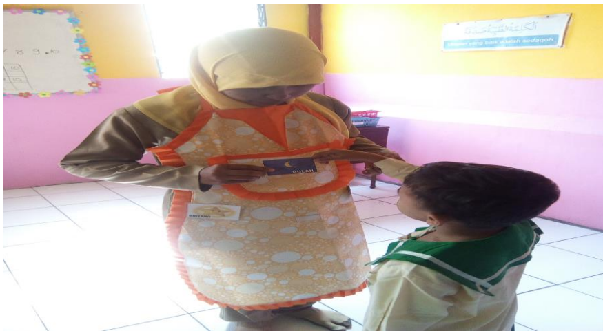
Gambar 4. Kegiatan membaca kartu kata siklus II