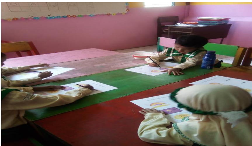
Gambar 5. Kegiatan menghubungkan kata dengan gambar