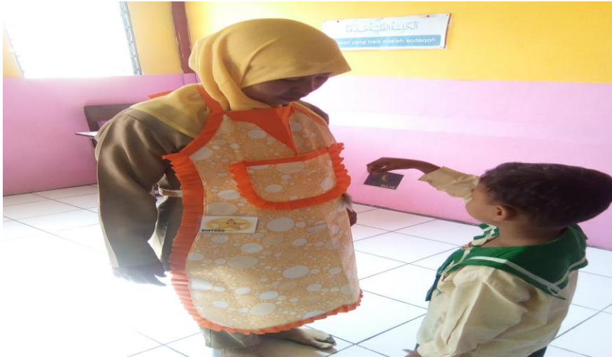
Gambar 3. Kegiatan membaca kartu kata siklus II