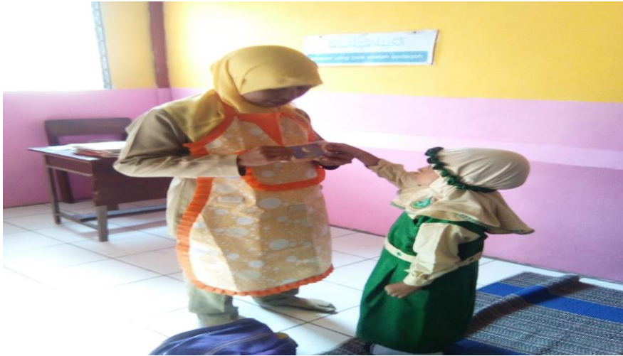
Gambar 3. Kegiatan membaca kartu kata pada siklus I