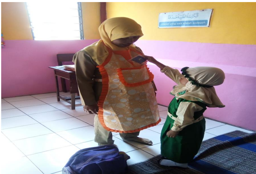
Gambar 2. Kegiatan siklus 1 waktu pengambilan kartu kata