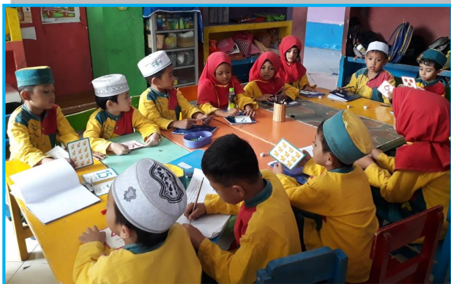
Gambar 8. Kegiatan Anak Mengurutkan Bilangan Dengan Gambar dalam Permainan Kartu Angka Bergambar Untuk Mengenal Lambang Bilangan