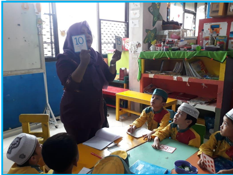
Gambar 4. Guru Mengenalkan Bilangan Dengan Menggunakan Kartu Angka Bergambar