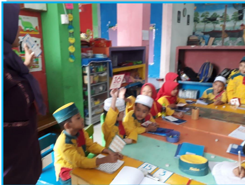
Gambar 5. Kegiatan Anak Menunjukkan Kartu Angka Bergambar Bilangan Yang Diminta oleh Guru