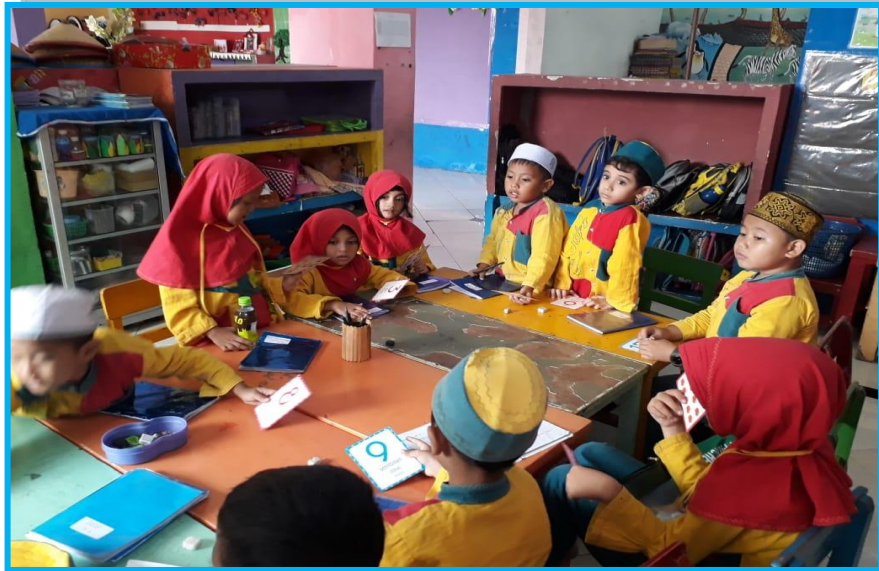
Gambar 7. Kegiatan Anak Memasangkan Bilangan Dengan Gambar dalam Permainan Kartu Angka Bergambar Untuk Mengenal Lambang Bilangan