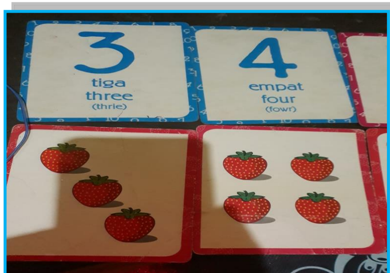
Gambar 3. Media Pembelajaran Mengenal Bilangan Dengan Menggunakan Kartu Angka Bergambar