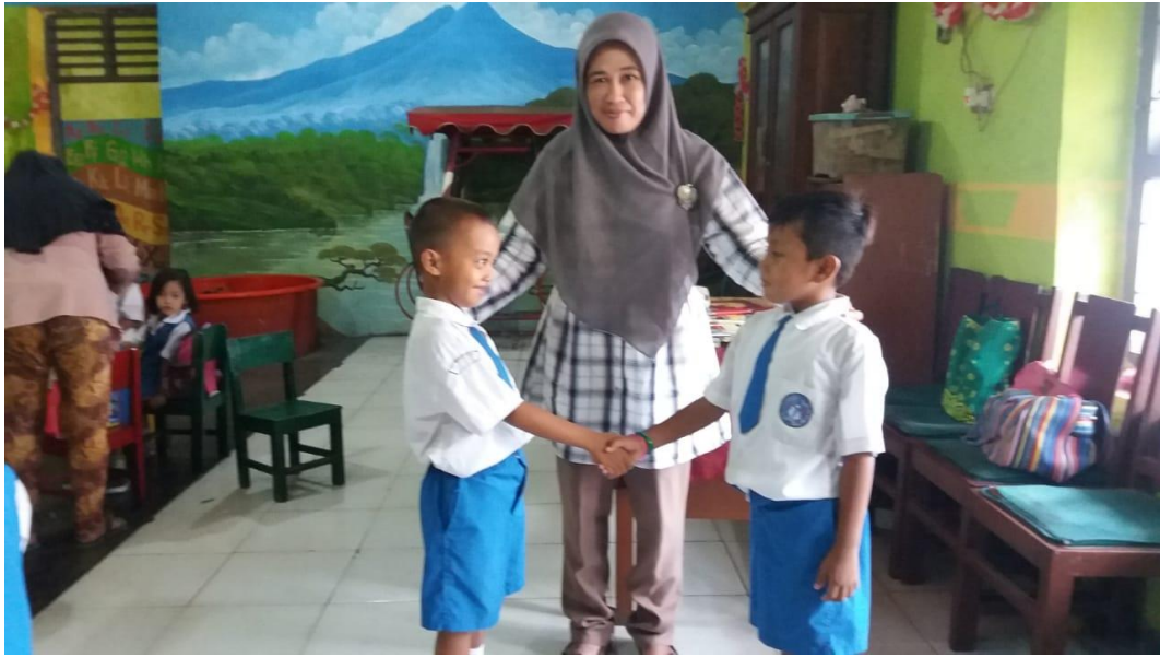
Foto Kegiatan Meminta Maaf