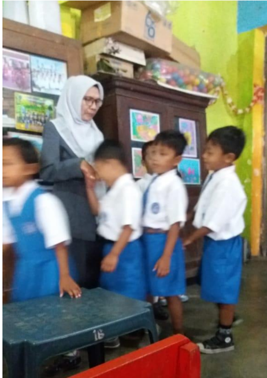
Foto Kegiatan Mau Masuk Sekolah