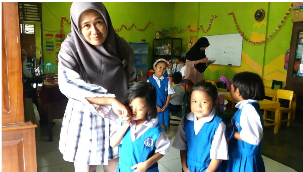
Foto Kegiatan Mau Pulang Sekolah