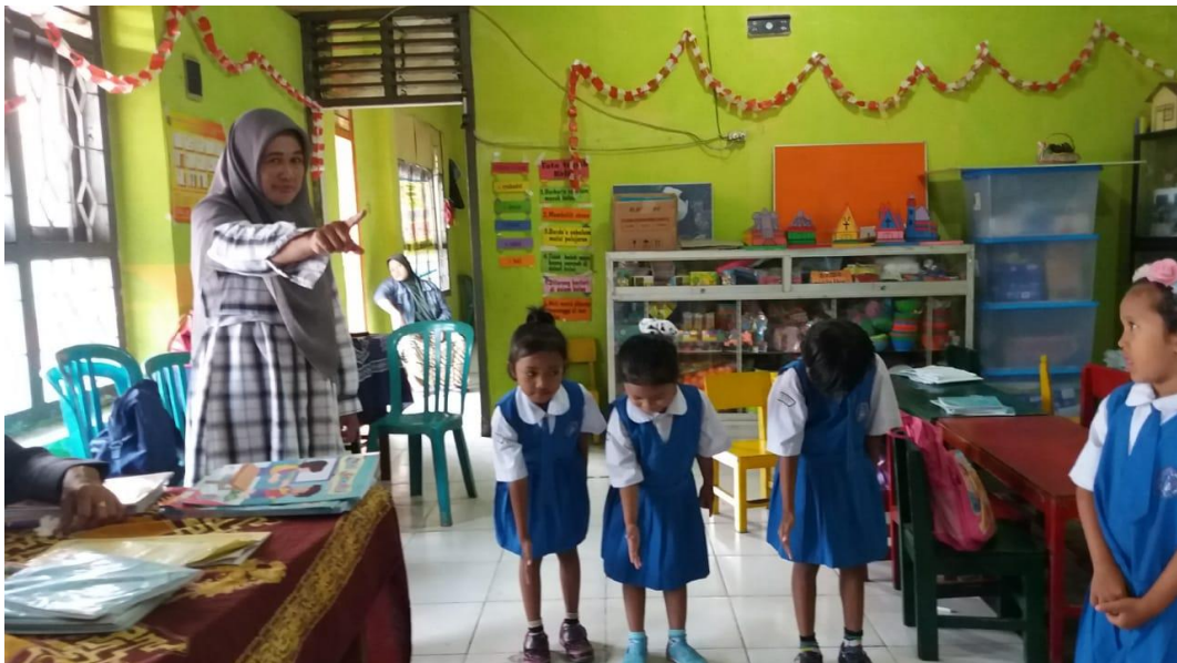
Foto Kegiatan Permisi