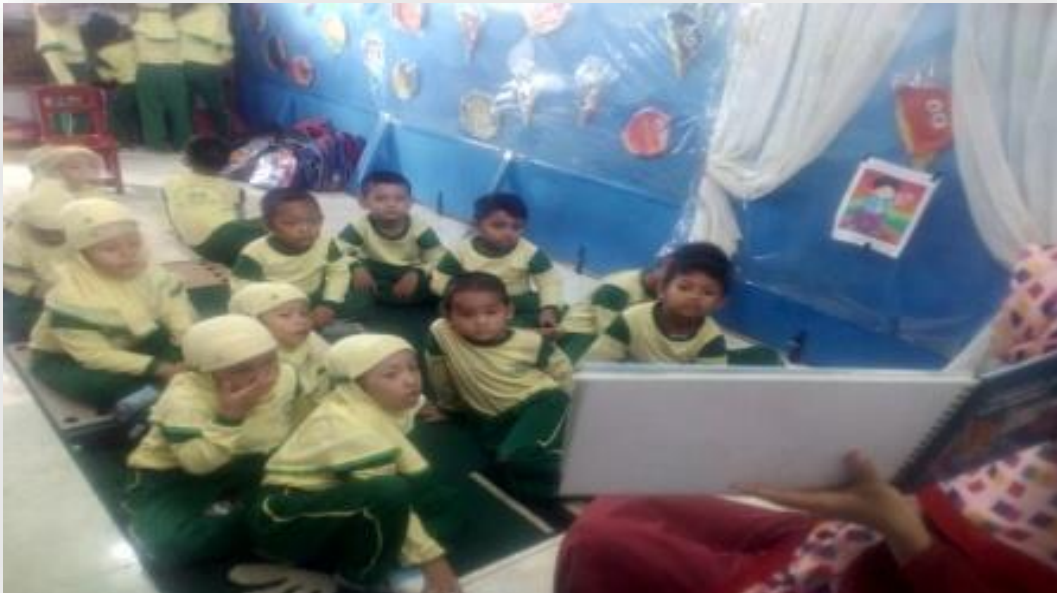
Kegiatan Treatment IV Scrapbook Edisi Nilai Kejujuran