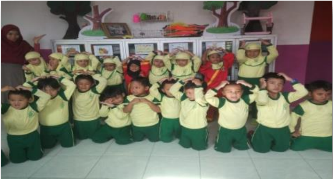
Kunjungan Ke TK 'Aisyiyah 04 Surabaya