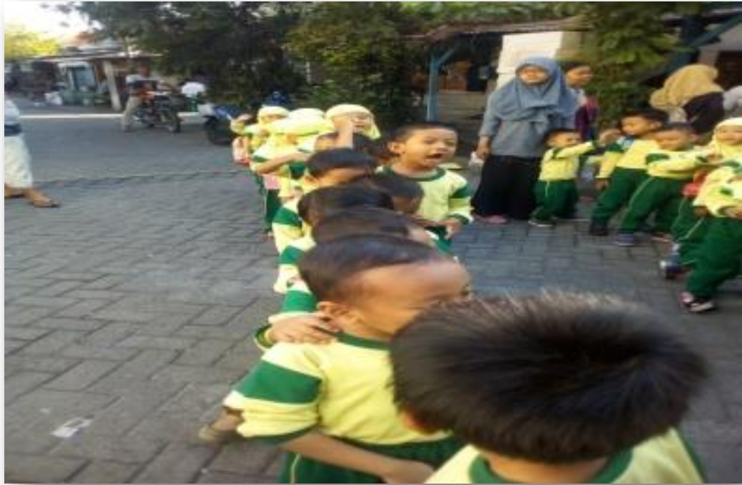
Kegiatan Post-test Scrapbook Edisi Nilai Kesabaran