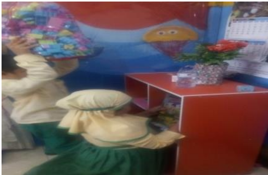
Kegiatan Post-test Scrapbook Edisi Nilai Tanggung Jawab dan Amanah