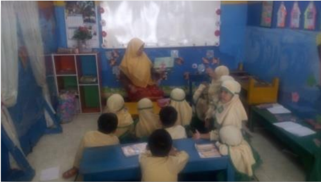
Kegiatan Treatment III Scrapbook Edisi Nilai Tanggung Jawab