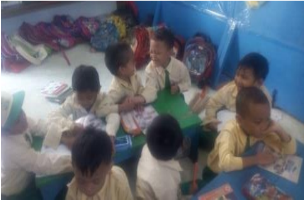
Kegiatan Post-test Scrapbook Edisi Nilai Kesabaran