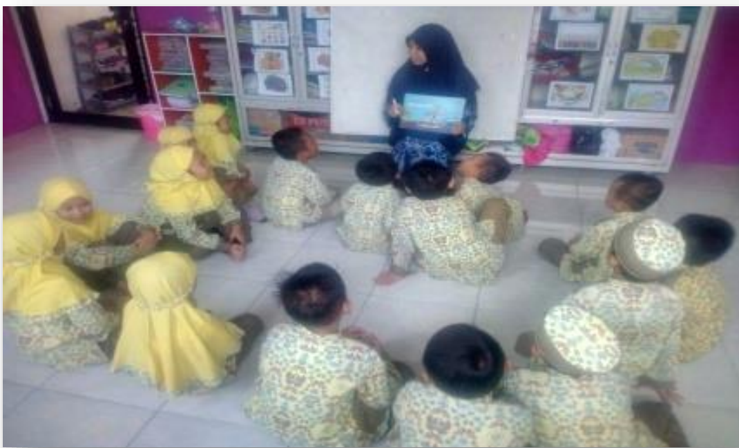
Kegiatan Treatment II Scrapbook Edisi Nilai Kejujuran