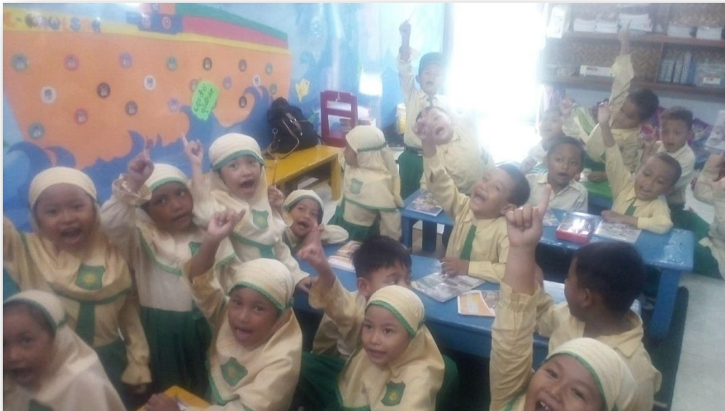
Kegiatan Treatment I