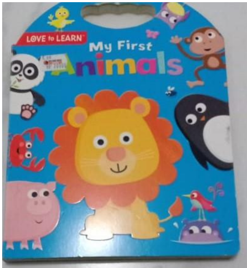
B. MEDIA BUKU CERITA 2