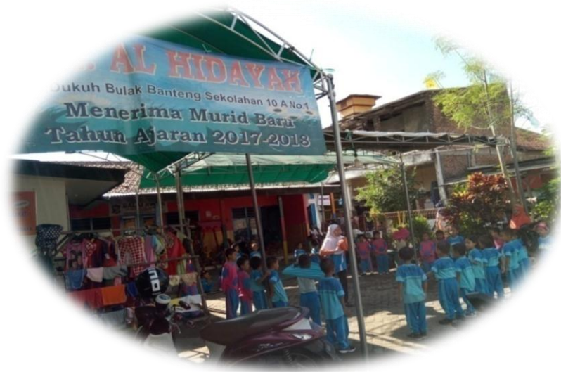
Gambar 4. Bangunan Sekolah TK Al-Hidayah