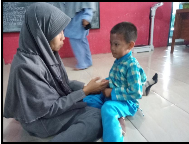
Gambar 12. Guru memberi nasehat kepada Responden-1