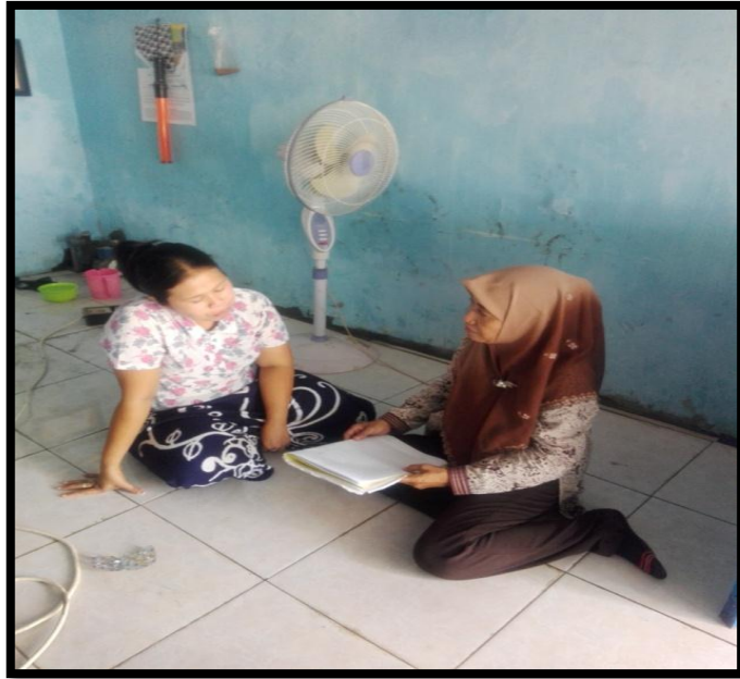
Gambar 8. Gambar Wawancara peneliti dengan Wali Murid ST