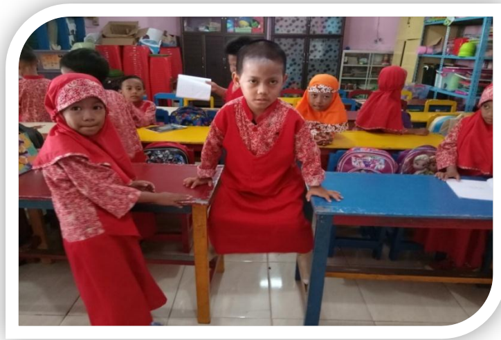
Gambar 10. Perilaku Responden-1