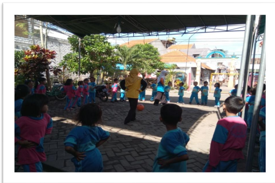
Gambar 5. Kegiatan Olah Raga