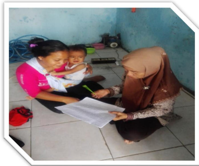
Gambar9. Gambar Wawancara Peneliti dengan wali Murid SH