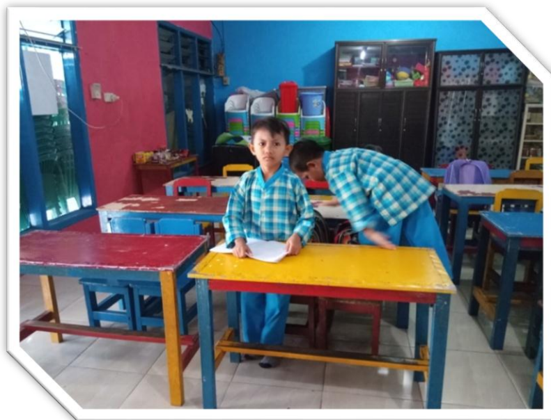
Gambar 11. Perilaku Responden-2