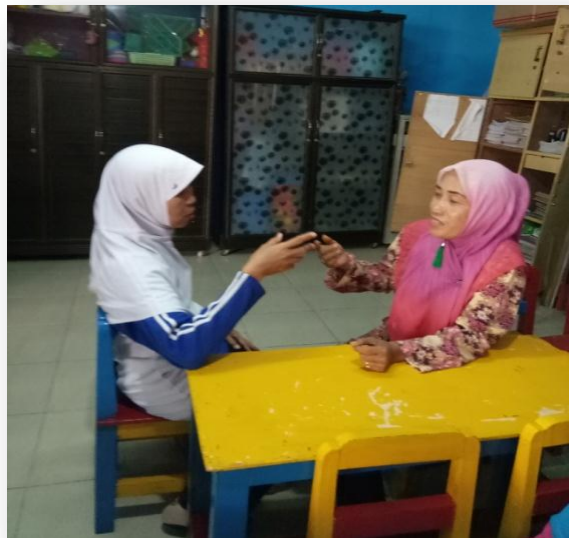
Gambar 7. Peneliti Mohon ijin Meminta Data untuk Penelitian di TK Al-Hidayah