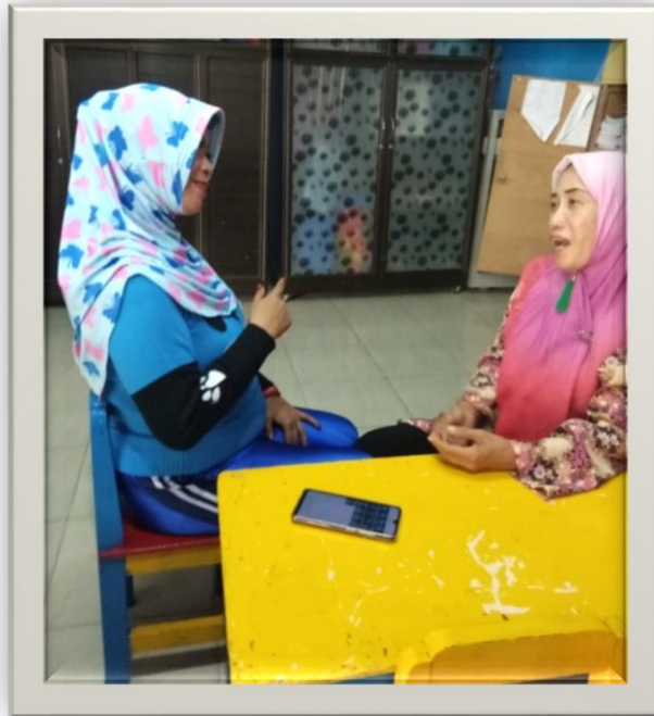
Gambar 6. Peneliti Mohon ijin Penelitian pada Kepala Sekolah TK Al-Hidayah