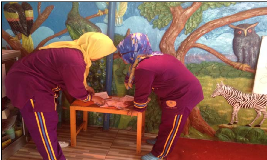
Gambar 4 Peneliti dan teman sejawat mengevaluasi hasil karya anak