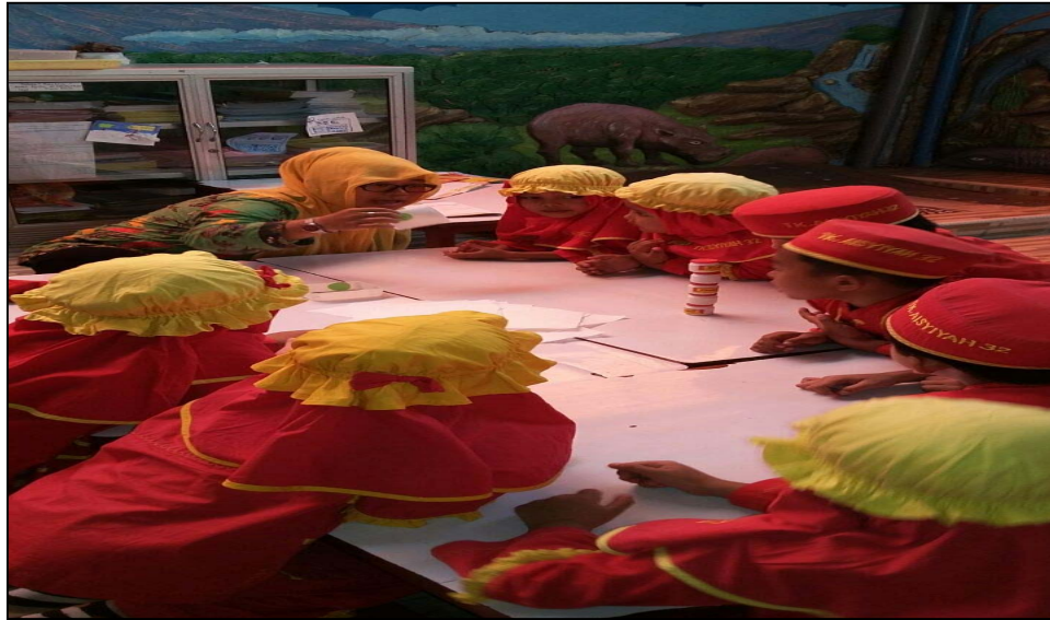
Gambar 9 Anak-anak antusias untuk melipat tissue roti