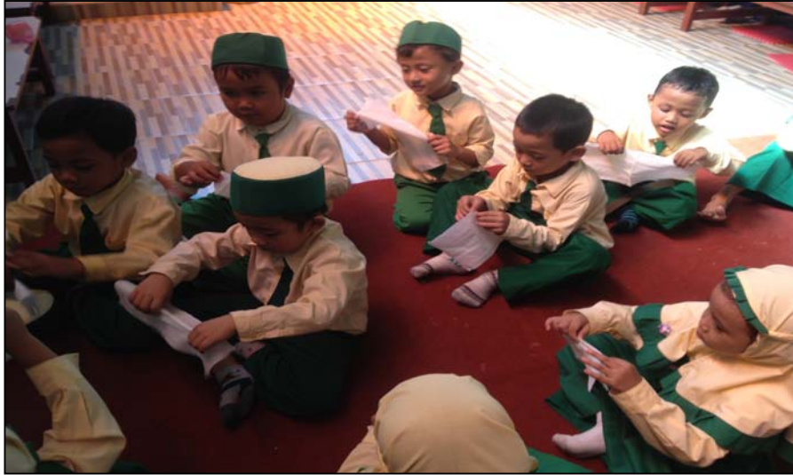
Gambar 1 Pengenalan melipat dengan tissue roti