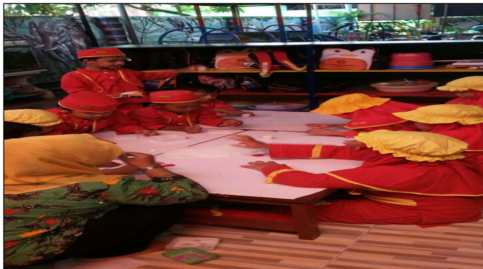
Gambar 10 Anak-anak sedang melipat bentuk amplop dengan tissue roti