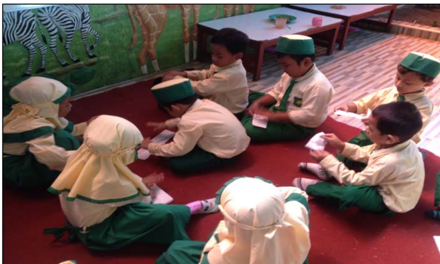
Gambar 2 Melipat bentuk buku dengan tissue roti