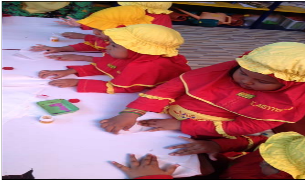
Gambar 11 Kegiatan anak sedang melipat bentuk amplop dengan tissue roti