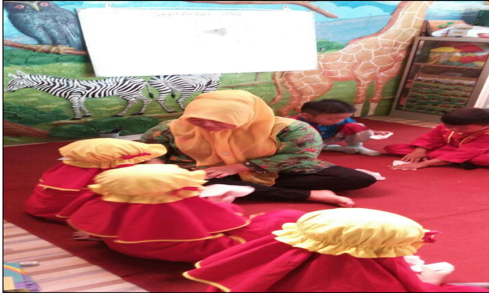
Gambar 7 Guru membantu anak yang kesulitan dalam melipat tissue roti