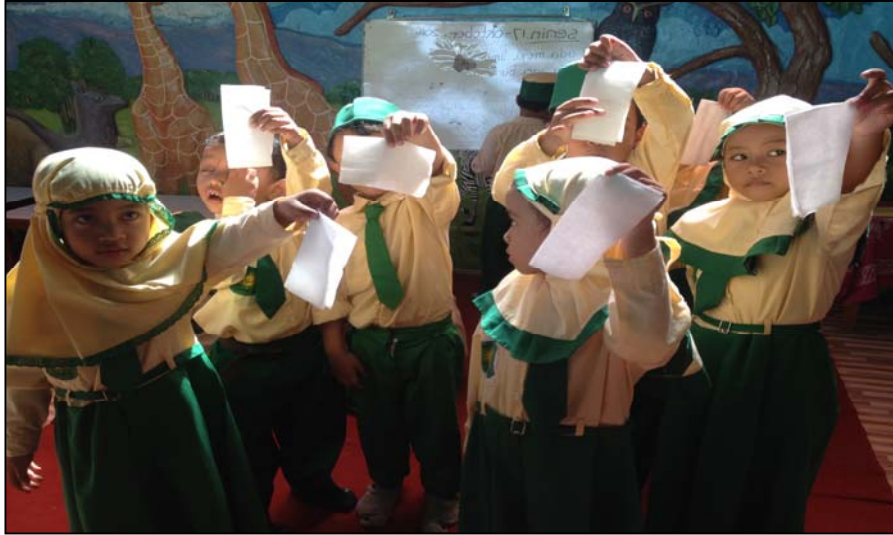
Gambar 3 Hasil melipat bentuk buku dengan tissue roti