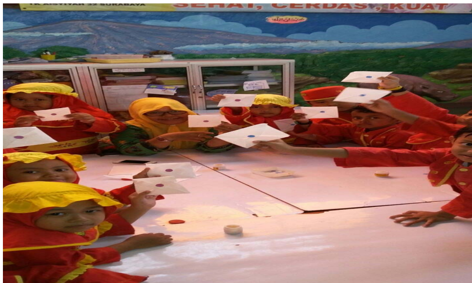
Gambar 12 Hasil karya anak melipat bentuk amplop dengan tissue roti