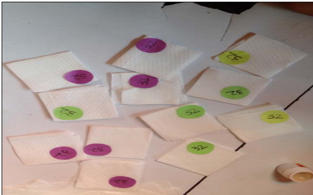
Gambar 8 Hasil melipat sapu tangan